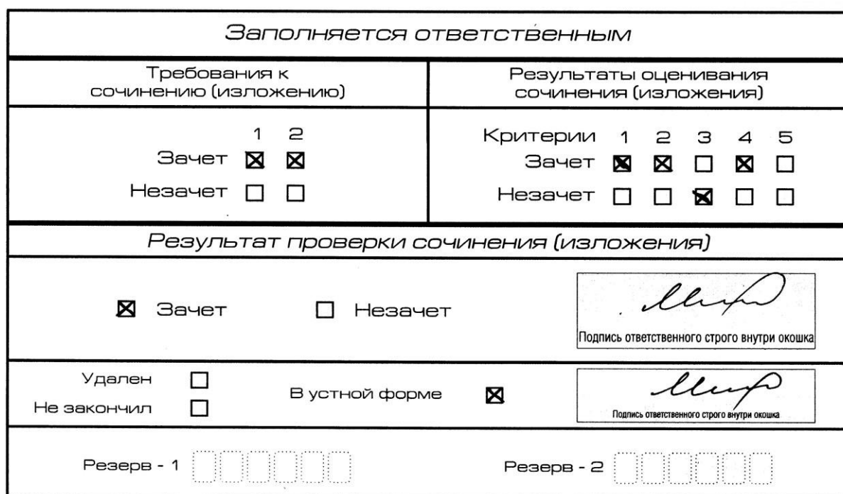
Рис. 11. Область для оценки работы сочинения (изложения) в устной форме

После окончания заполнения бланка регистрации ответственное лицо ставит свою подпись в специально отведенном для этого поле.