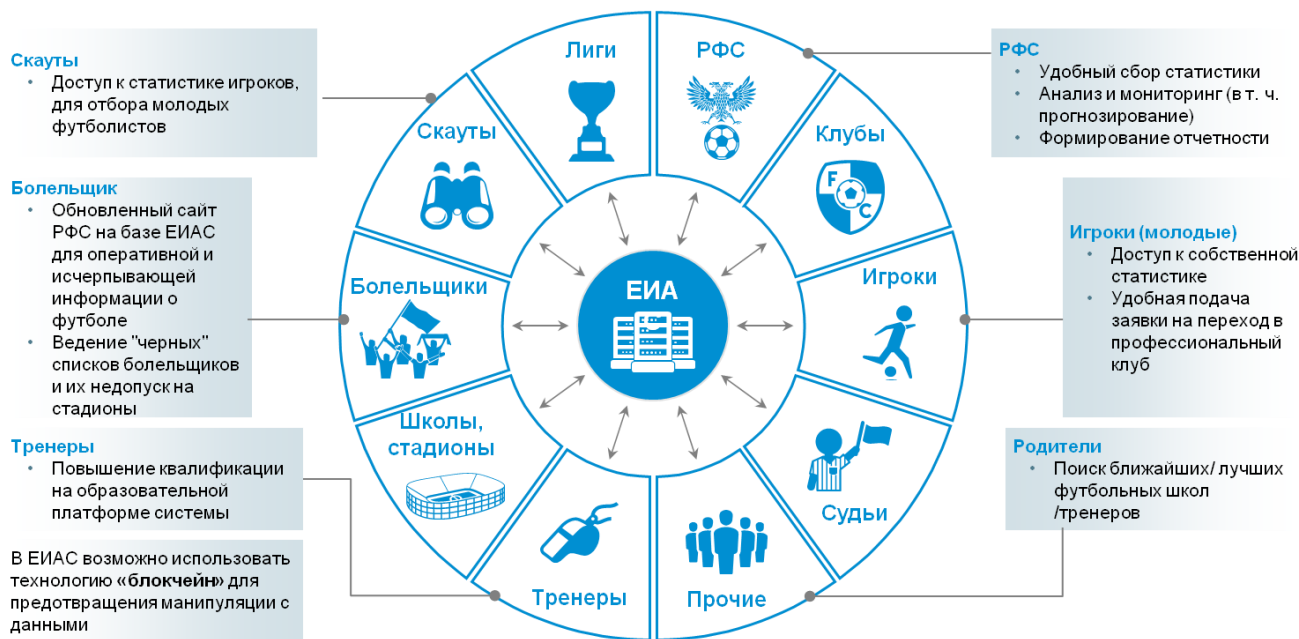
Структура единой информационно-аналитической системы (проект)

ЕИАС РФС состоит из двух частей - административной и публичной (подсистема футбольного менеджмента и подсистема маркетинга в футболе).