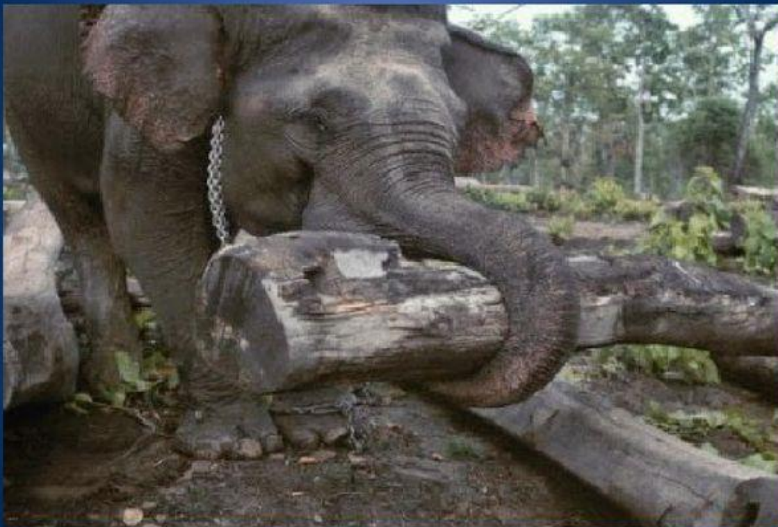
Слон несет бревна