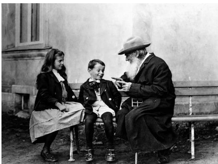
Фотография. Л.Н. Толстой и ученики Яснополянской школы