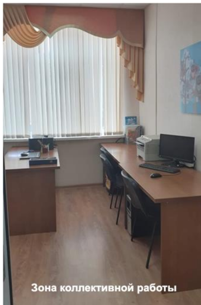
Зона коллективной работы