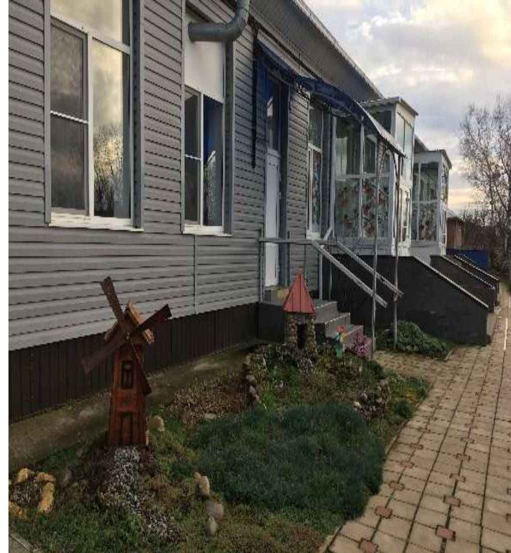
детский сад «Сказка»