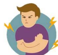
Боли в мышцах и суставах