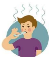
Температура 39 – 40^{\circ}\text{C}