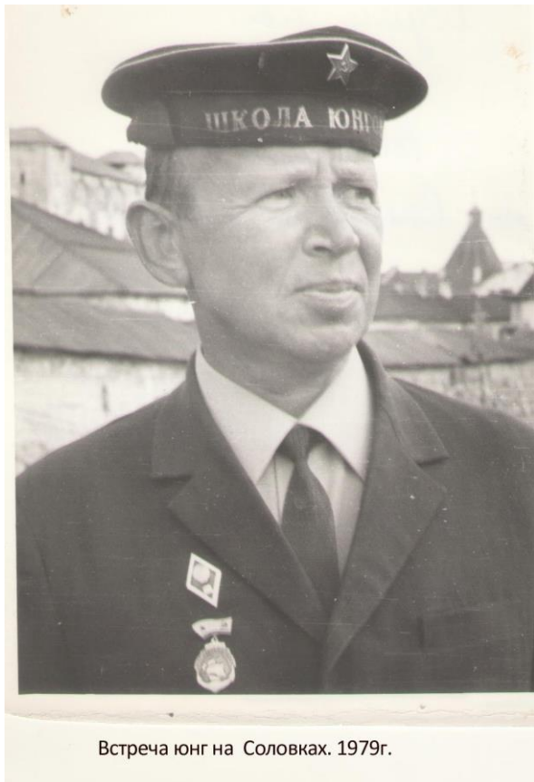
Встреча юнг на Соловках. 1979г.