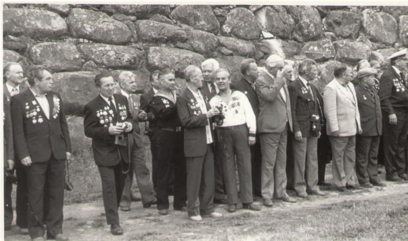
Встреча юнг на Соловках. 1979 г.