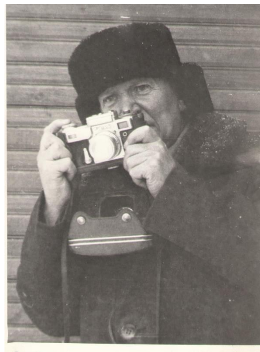
За работой для газеты. 1989г.