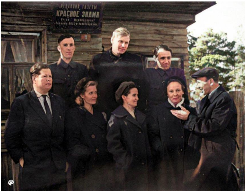
Среди коллектива редакции г.Шенкурск, крайний справа