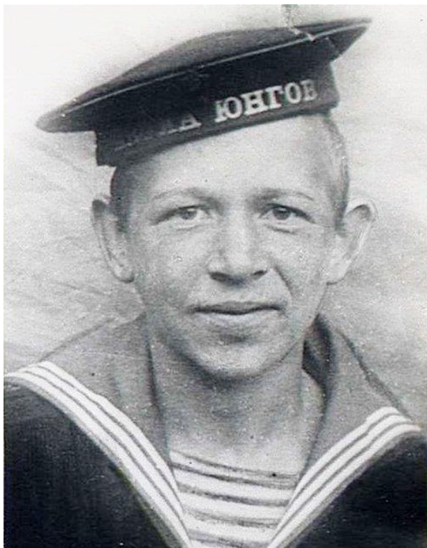
Юнга ВМФ, 1944г