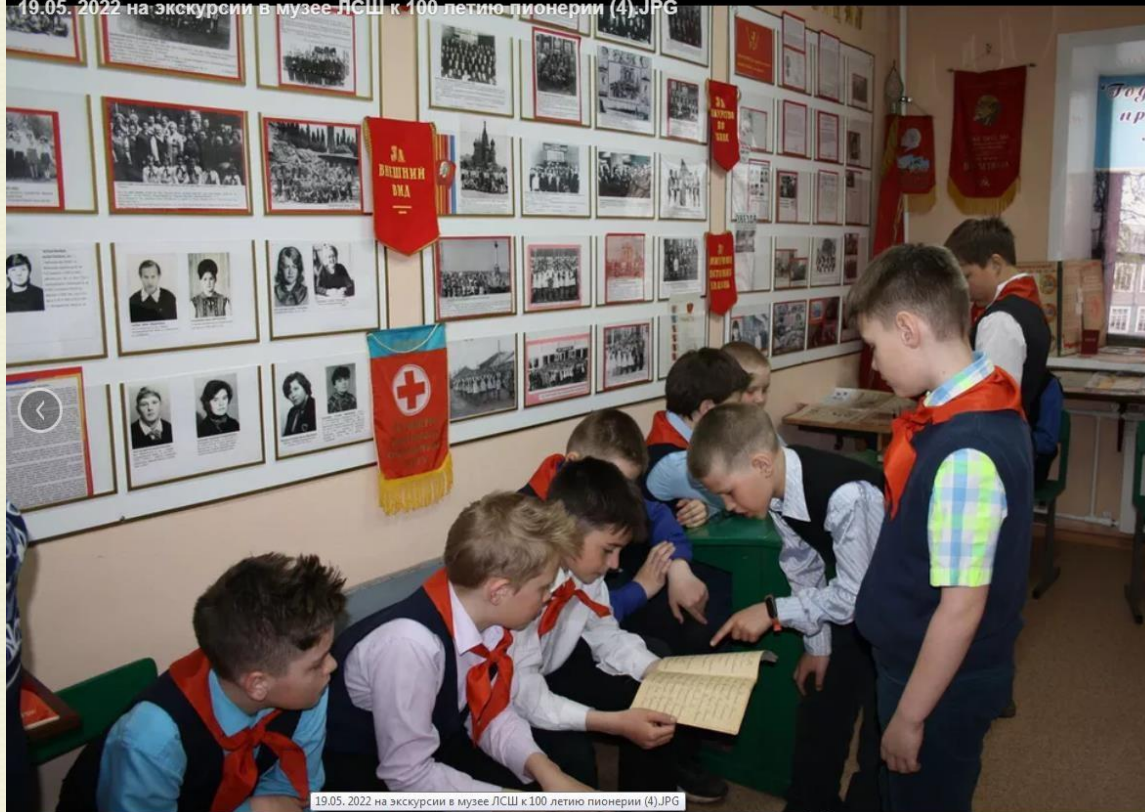
19.05. 2022 на экскурсии в музее ЛСШ к 100 летию пионерии (4).JPG

Экскурсии для учащихся в музее Лешуконской средней школы в зале истории пионерской и комсомольской организаций