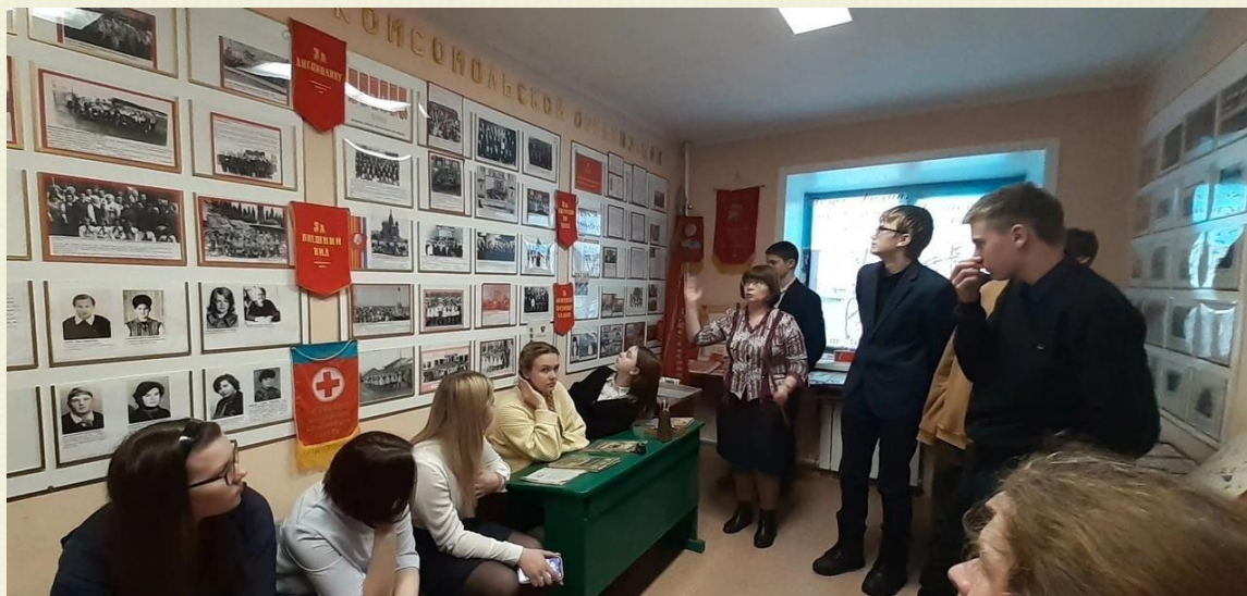
19.05. 2022 на экскурсии в музее ЛСШ к 100 летию пионерии (4).JPG