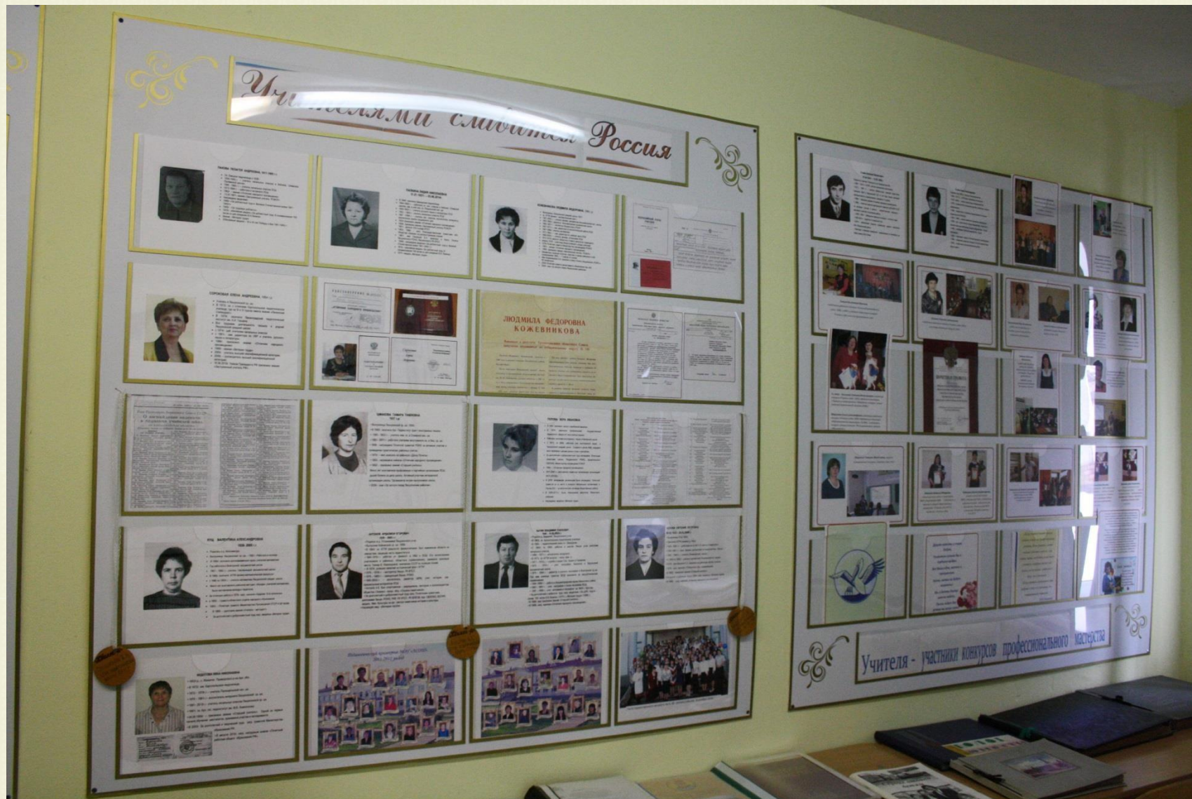
Стенды в зале «Этапы развития школы»