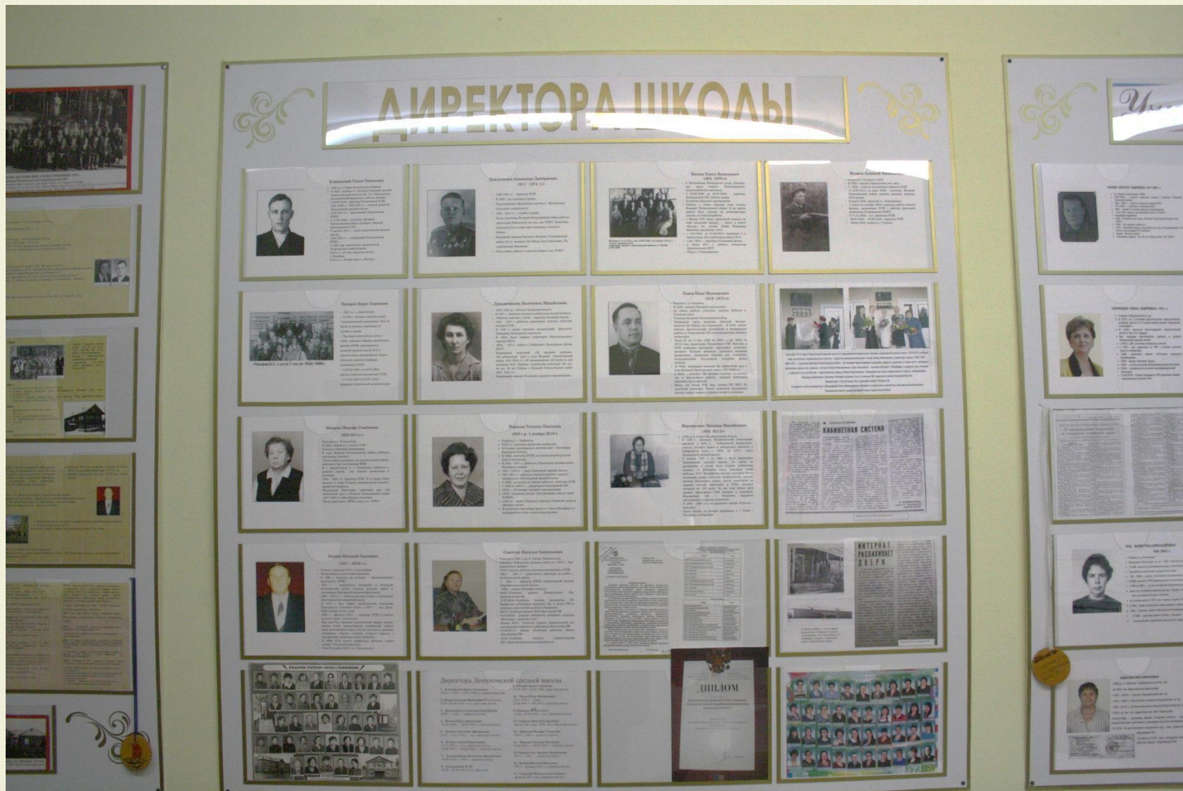
Стенды в зале «Этапы развития школы»