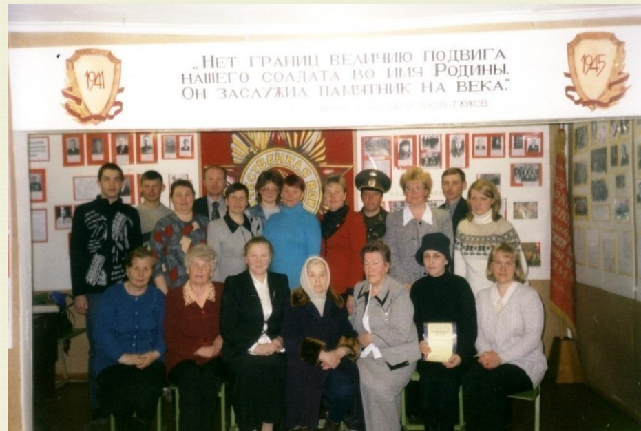
На открытии школьного музея ЛСШ, 2005г.