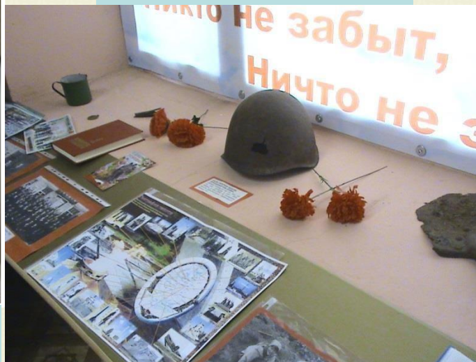
Реликвии с мест сражений.