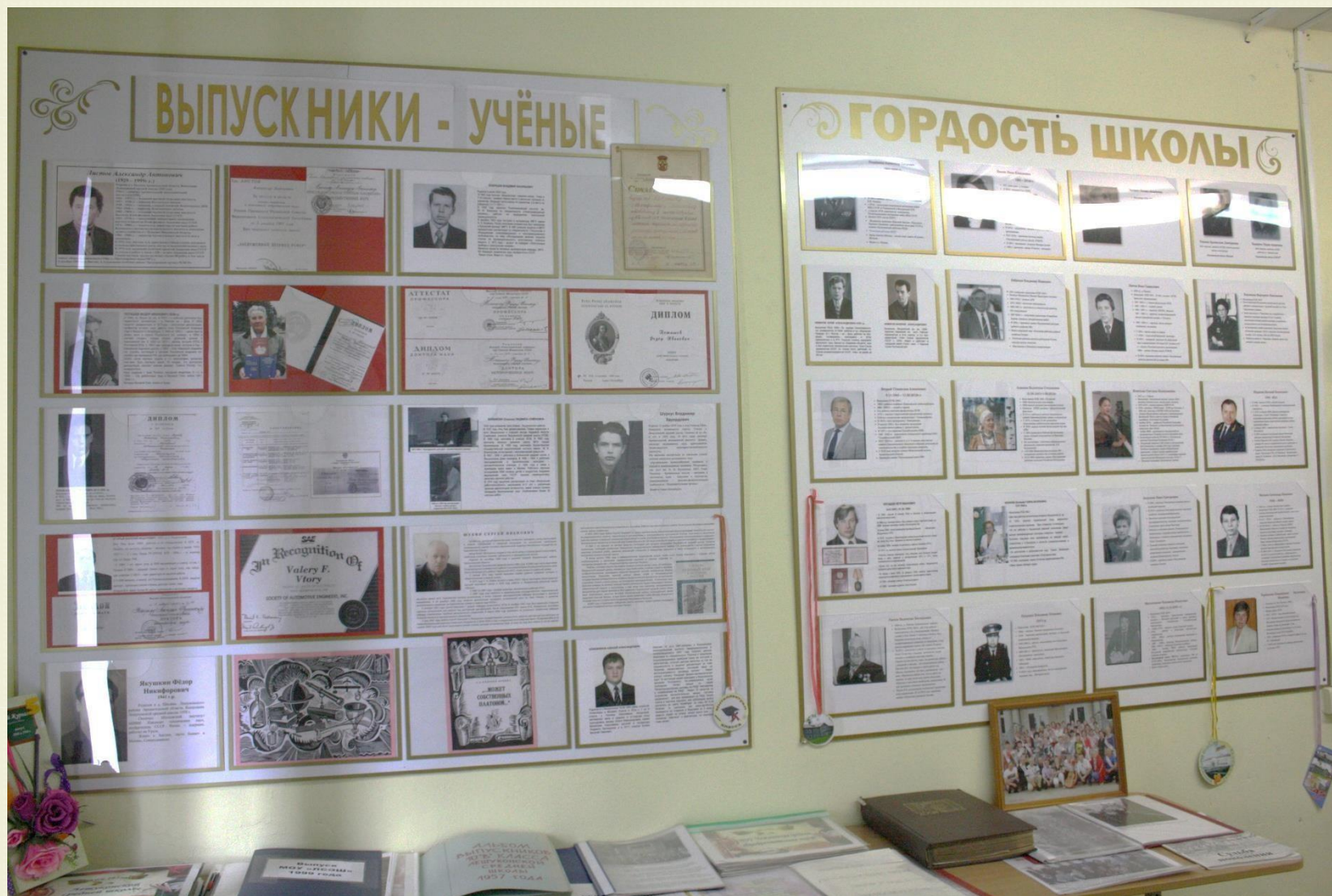
Стенды в зале «Этапы развития школы»