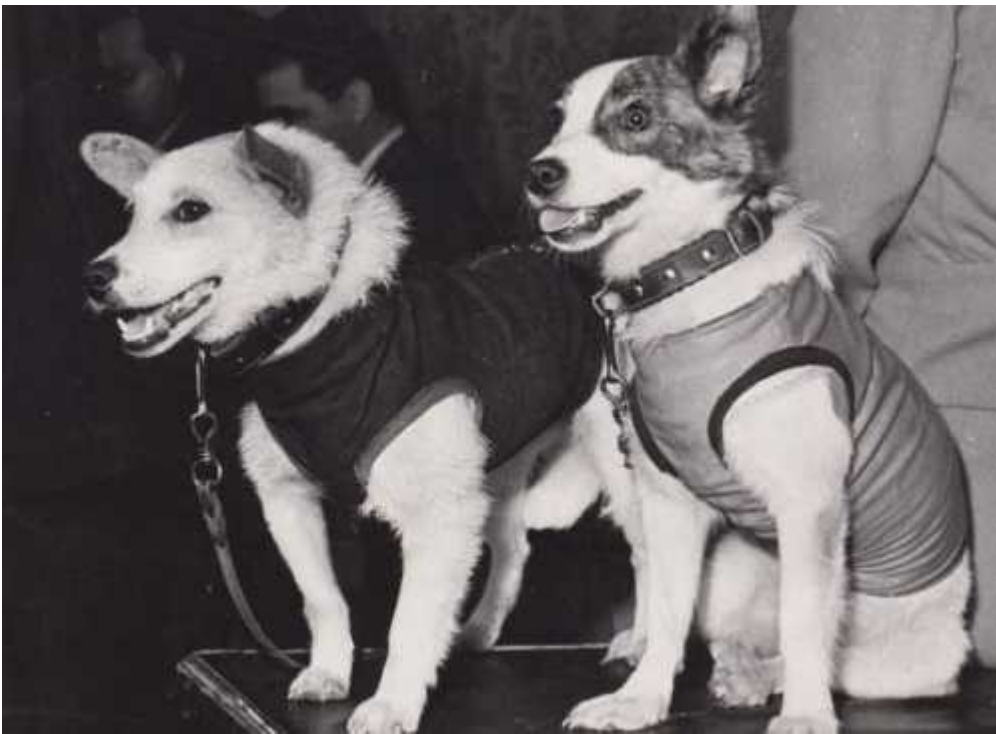
Белка и Стрелка.