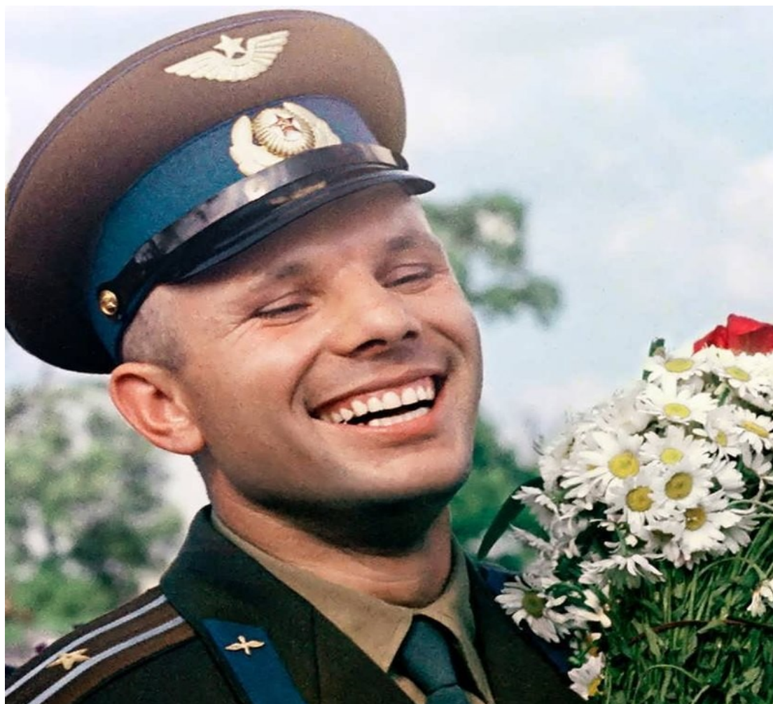
Юрий Гагарин — первый космонавт.