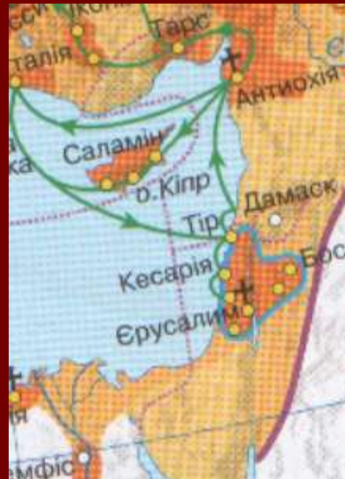
Палестина ( Иудея ) – район возникновения христианства.