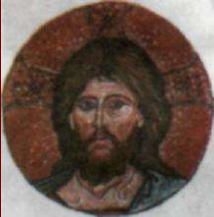
Портрет Иисуса — так Его изображали в первые столетия после Распятия