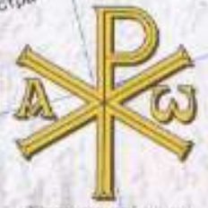
Християнський символ I ст.