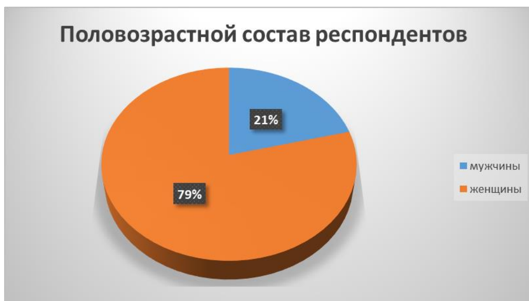
Диаграмма № 1

Таким образом, в анонимном анкетировании и социологических опросах приняли участие 4073 респондента в возрасте от 14 до 67 лет, в том числе мужчины – 855 человек, женщины – 3218 человек. Охват численности респондентов соответствует требованиям, предъявляемым к численности и структуре выборочной совокупности респондентов (Диаграмма № 1).