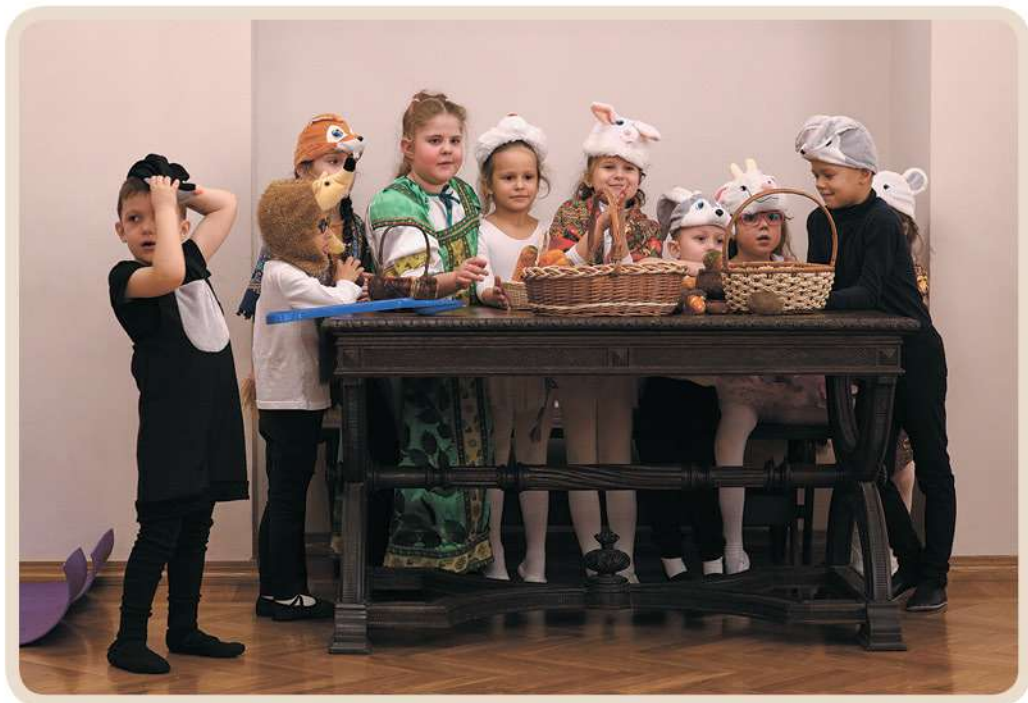
Воспитанники «ЛогоТеатра» в спектакле «Мешок яблок» В. Сутеева