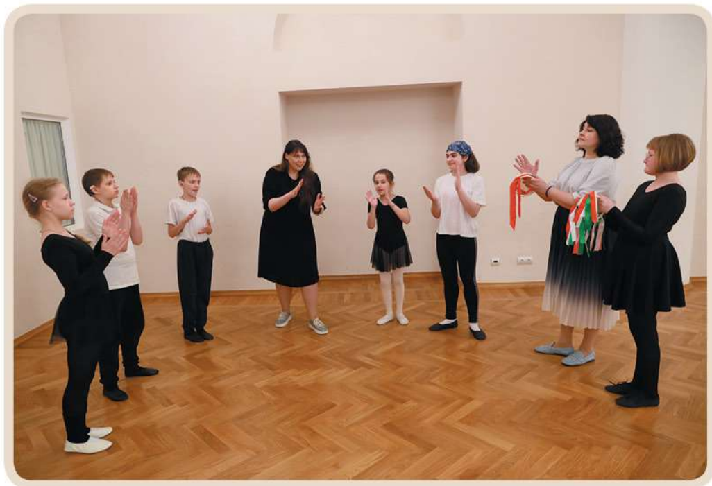
Упражнения для развития чувства ритма