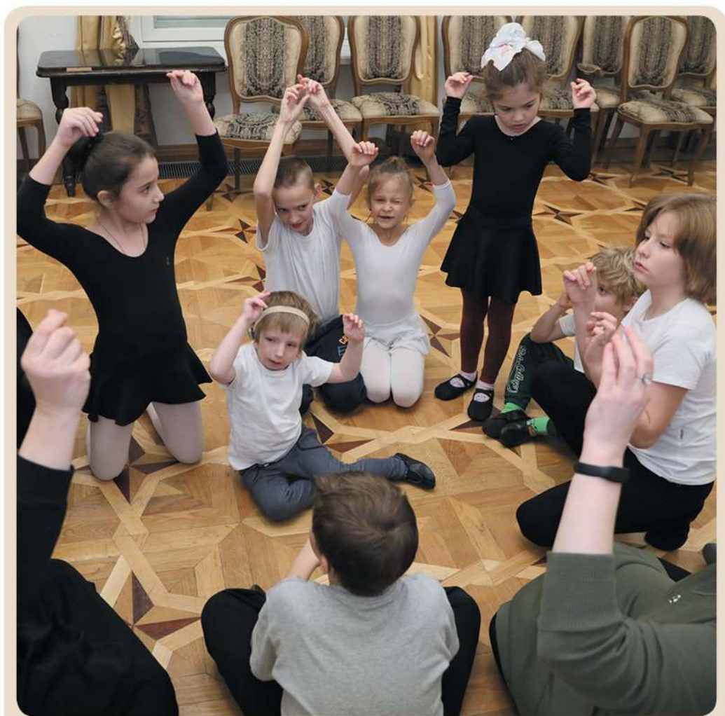
Ритмические упражнения для развития речи