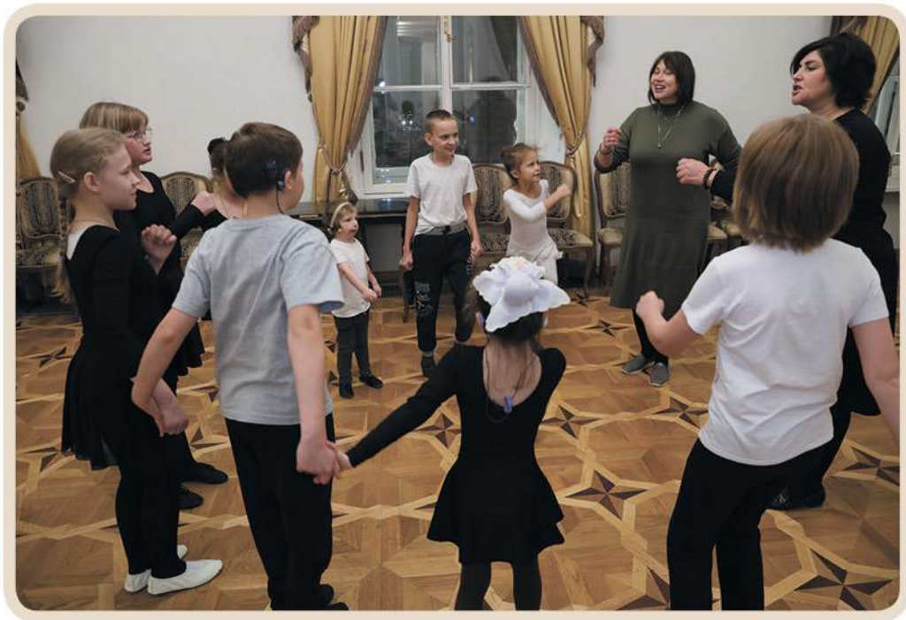
Упражнение «Броуновское движение»