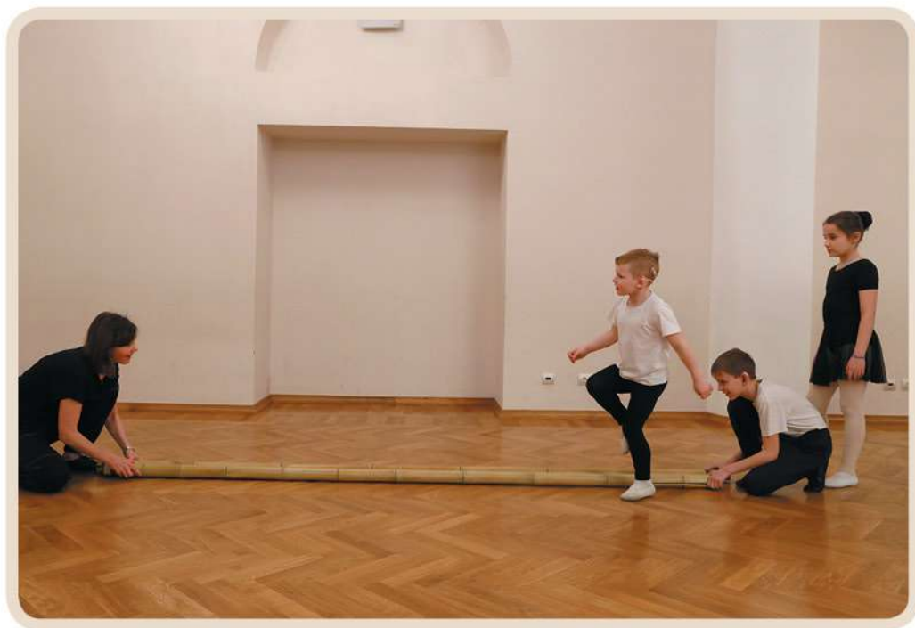
Вьетнамский танец с бамбуковыми палками