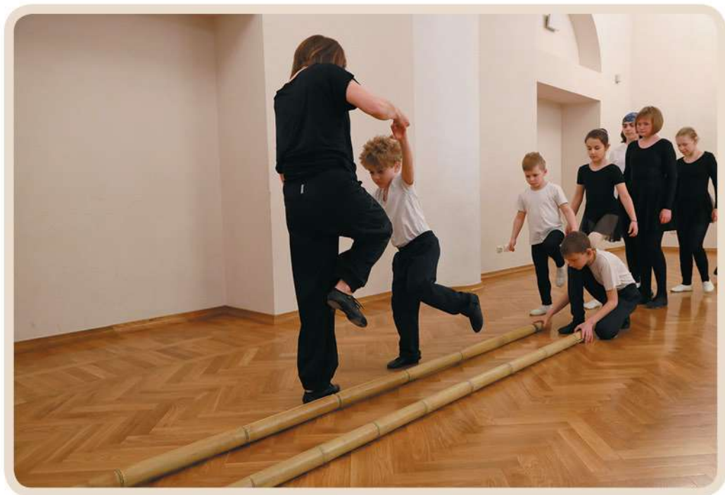
Вьетнамский танец с бамбуковыми палками