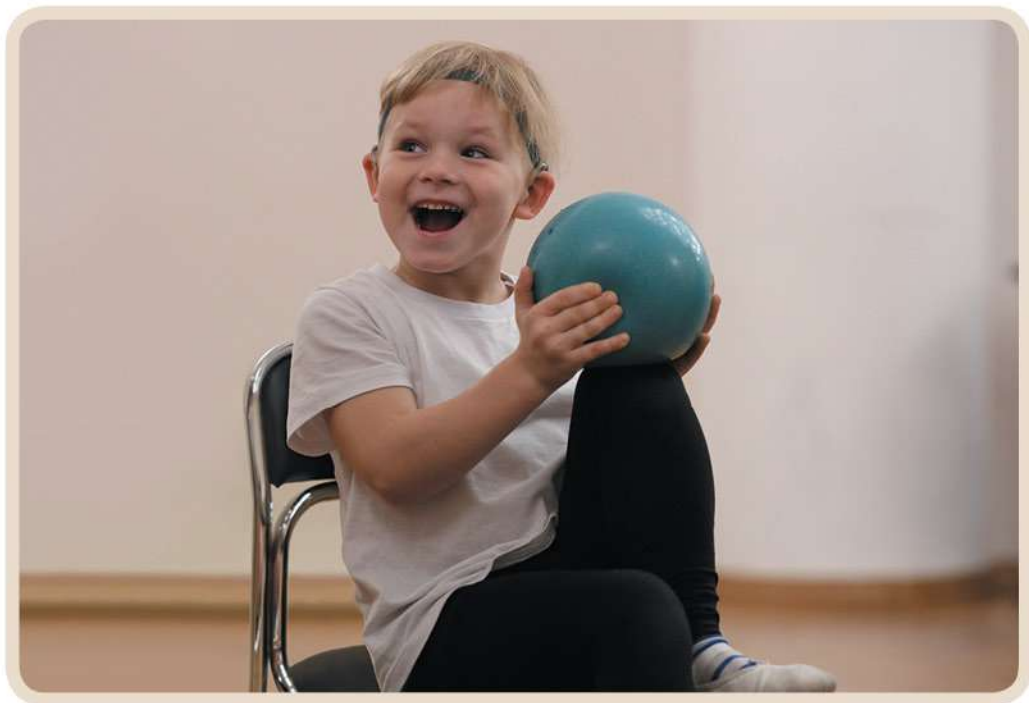
Игра для развития эмоциональной памяти