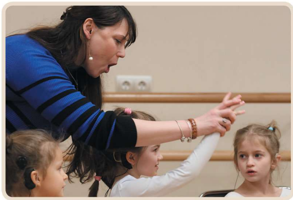
Упражнения для развития голоса