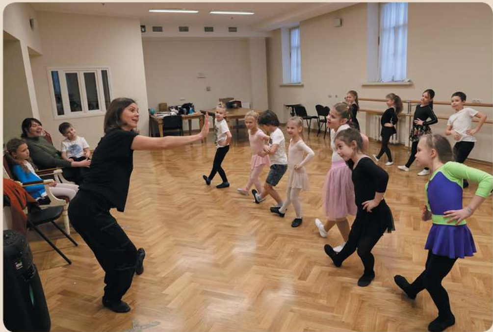
Урок народного танца