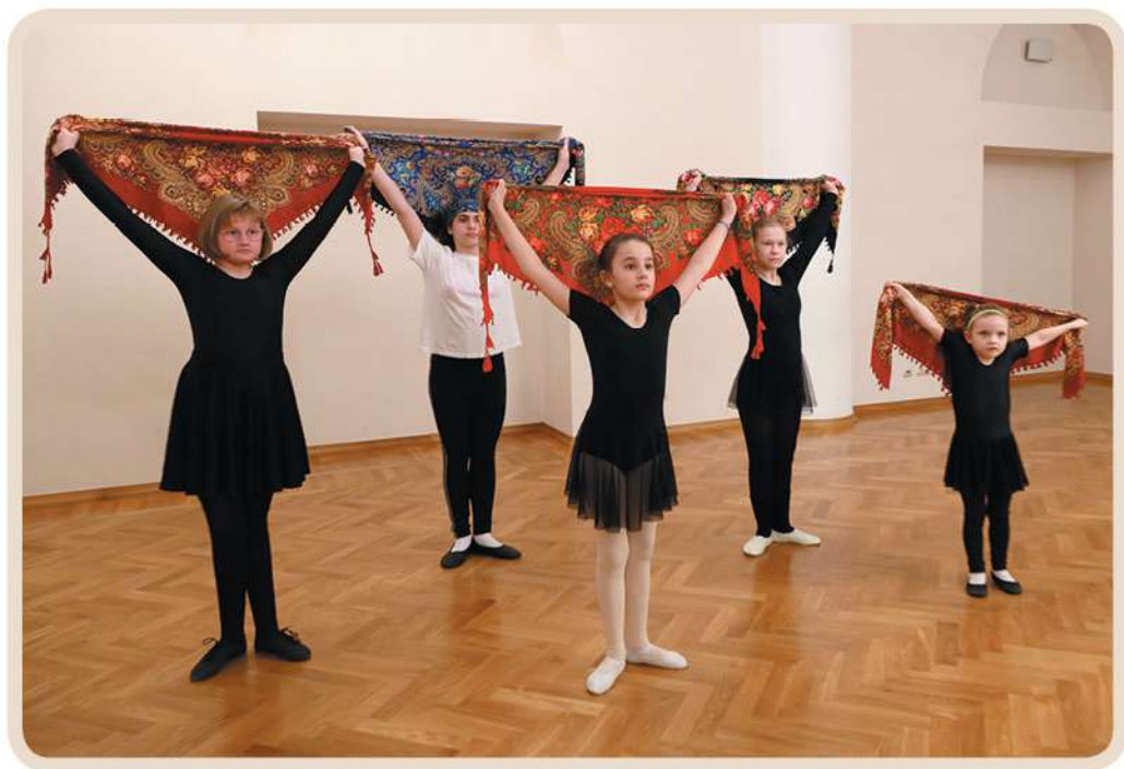
Русский народный танец