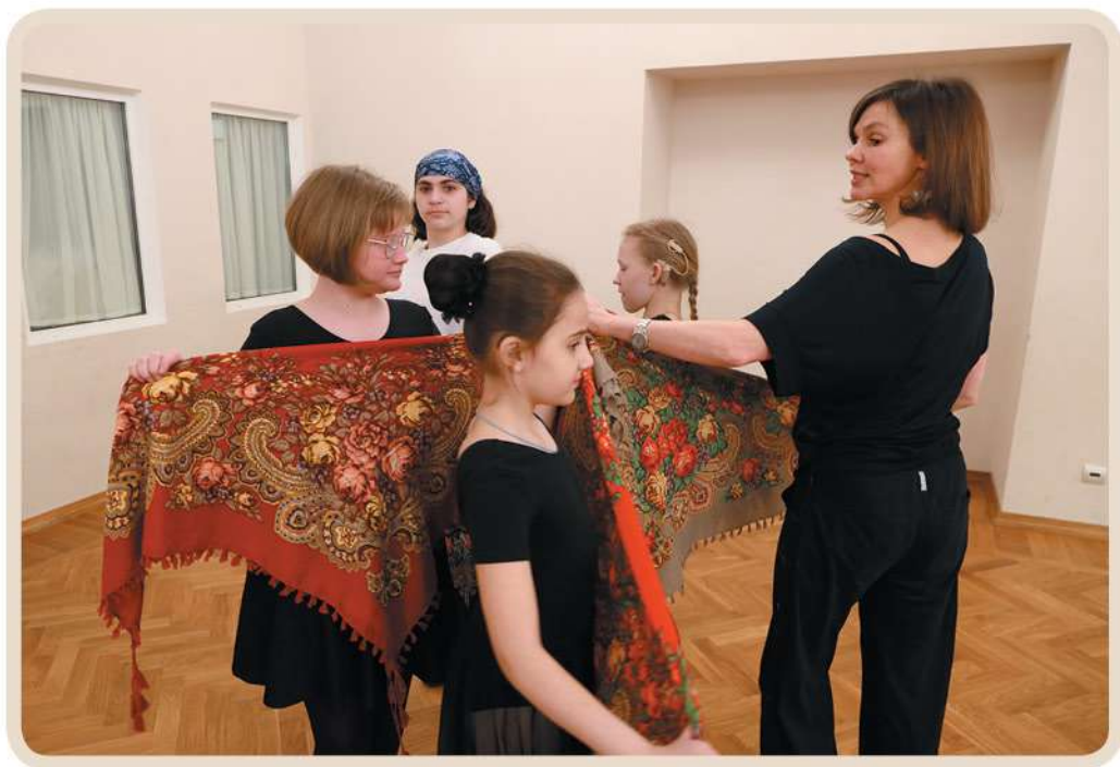
Русский народный танец