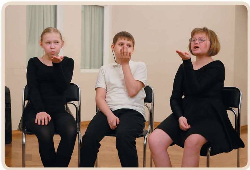
Упражнения для развития речевого дыхания