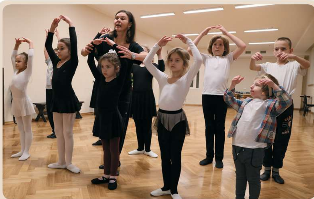
Урок классической хореографии