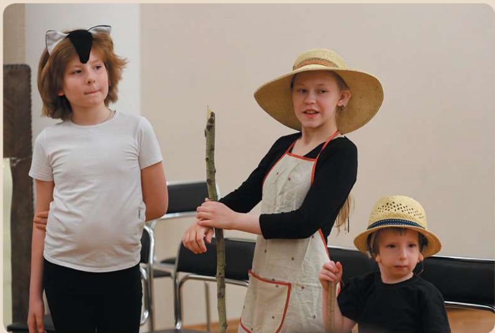
Открытый урок «Дом, который построил Джек» С.Я. Маршака