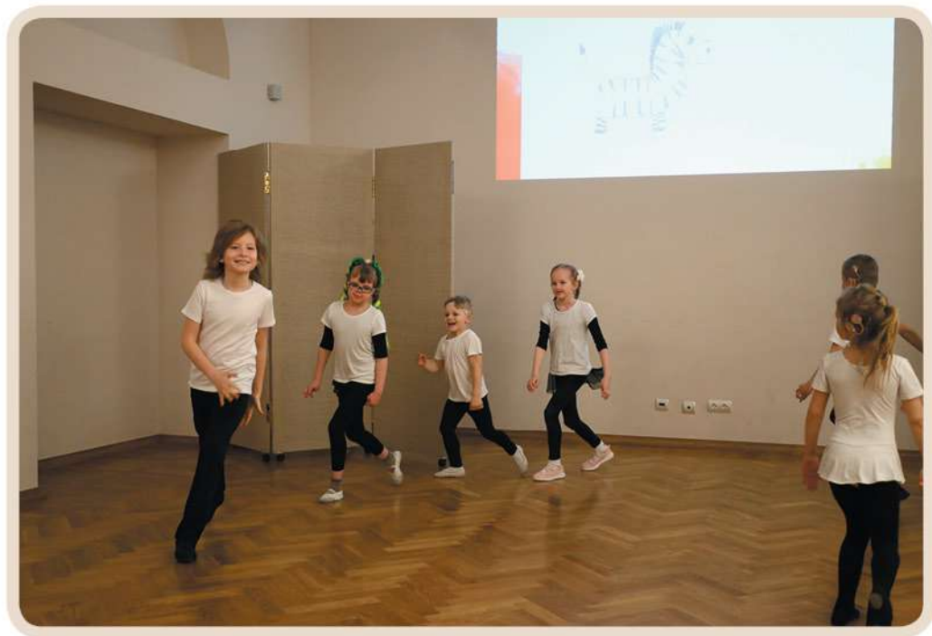
Открытый урок «Джунгли зовут»