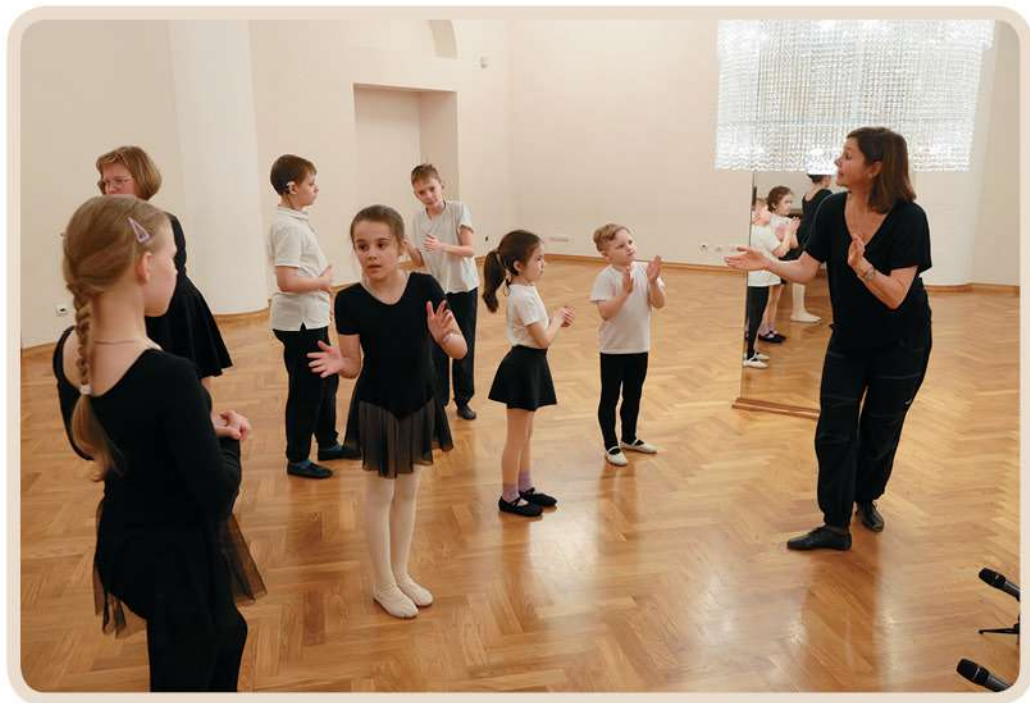
Урок классической хореографии