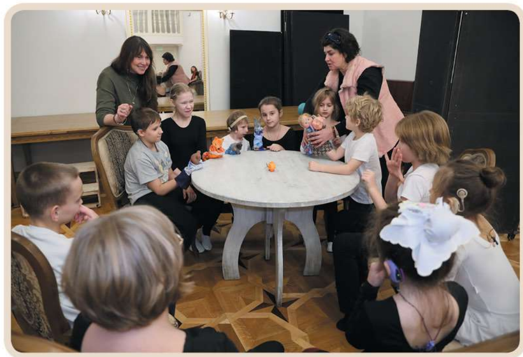
Театр «Би-ба-бо». Сказка «Колобок»