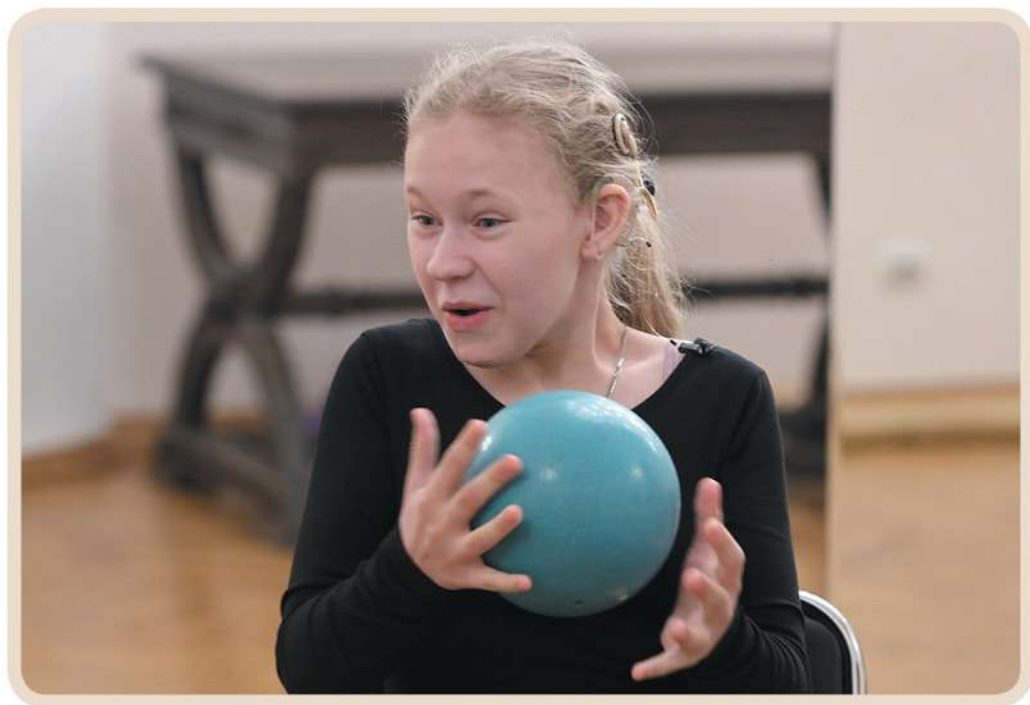
Игра для развития эмоциональной памяти