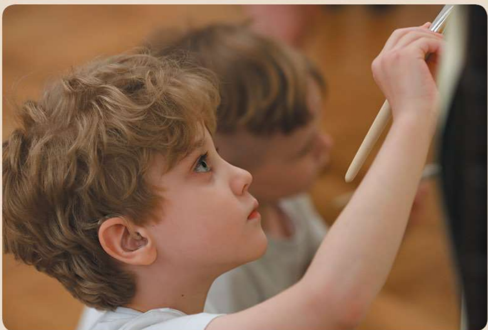
Открытый урок «Айболит» К.И. Чуковского