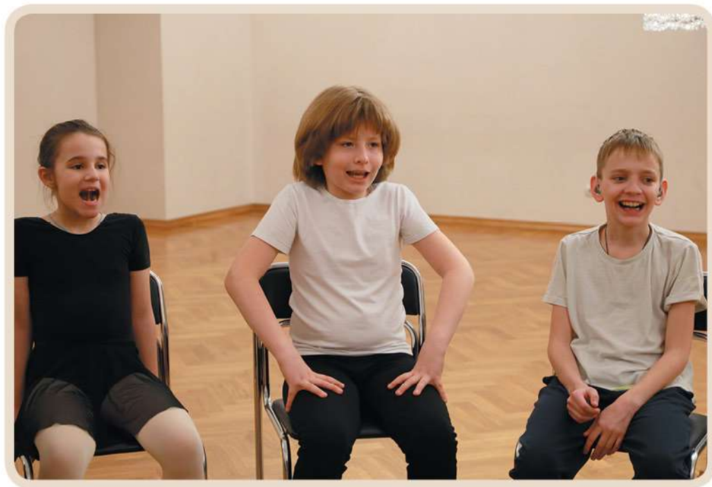
Упражнения для развития речевого дыхания