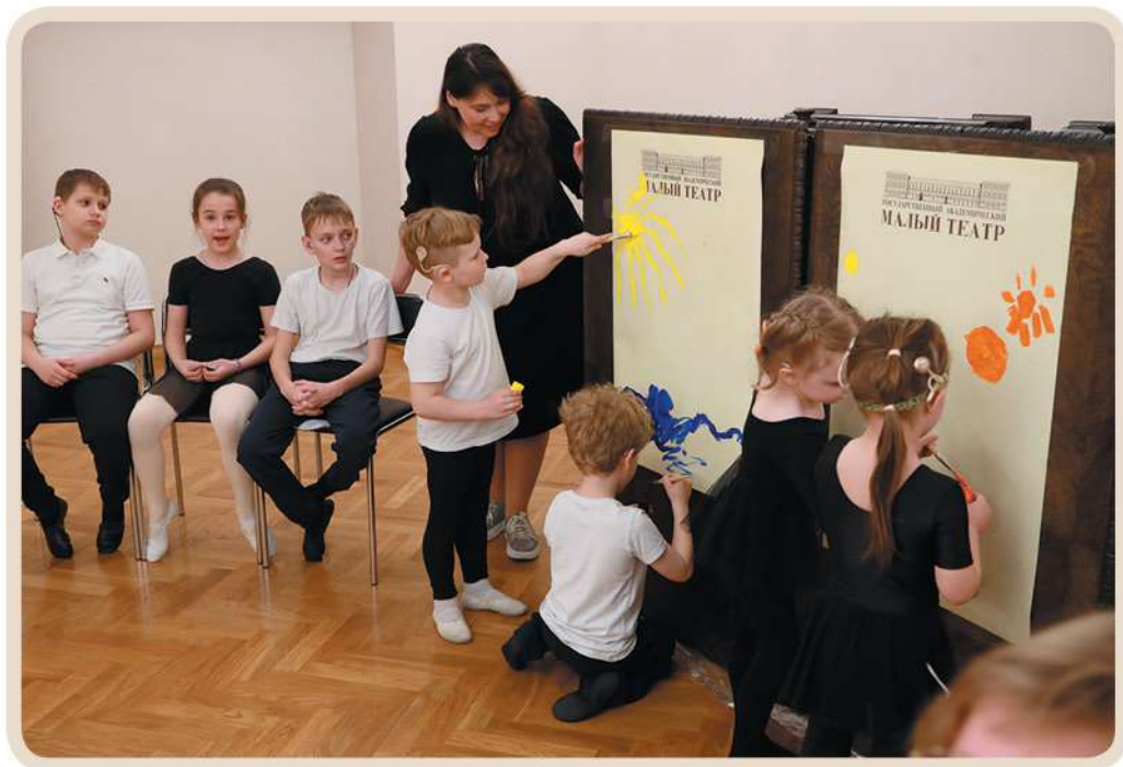
Открытый урок «Айболит» К.И. Чуковского