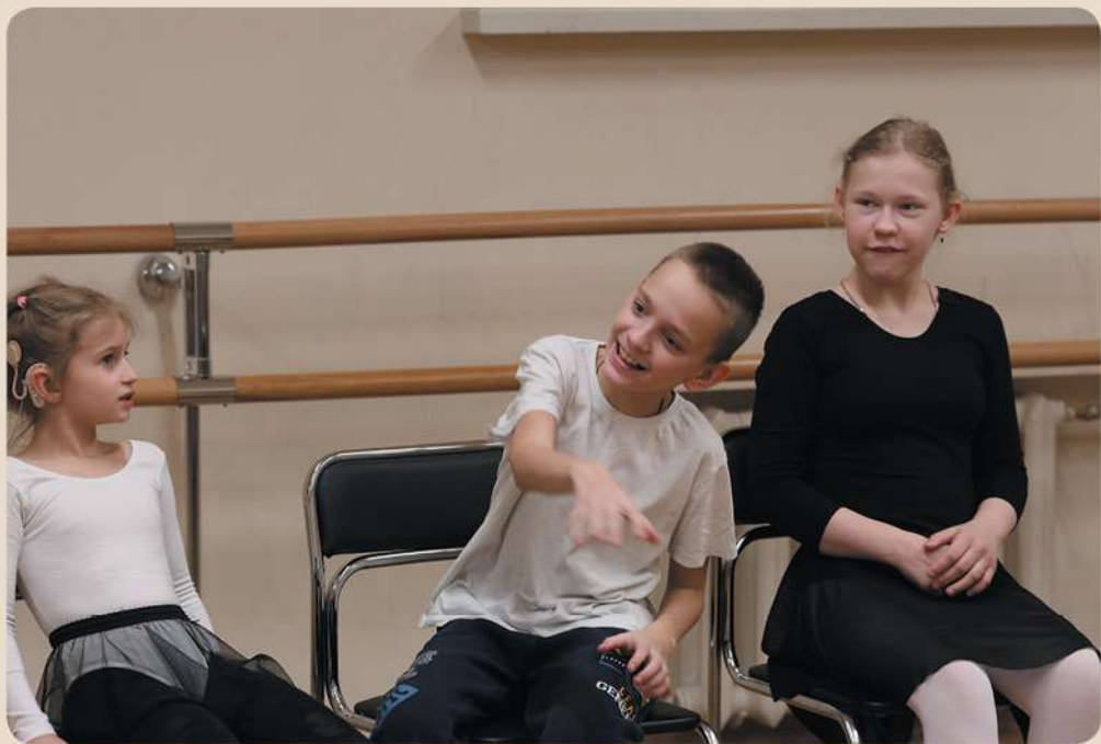
Упражнения для развития голоса