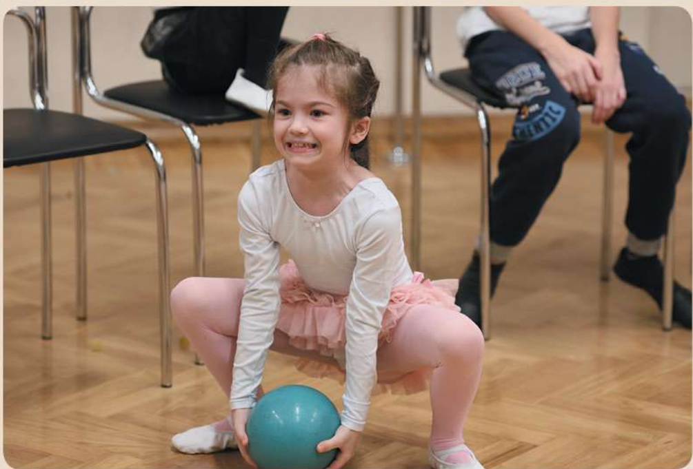
Упражнение «Передай волшебный мяч»