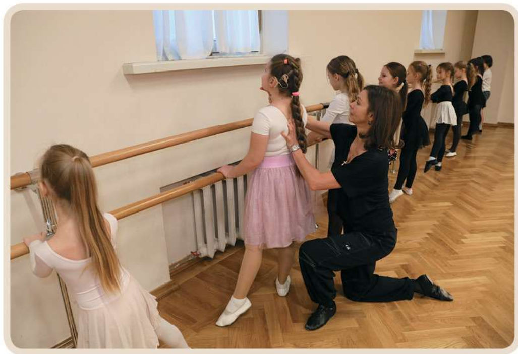
Урок классической хореографии