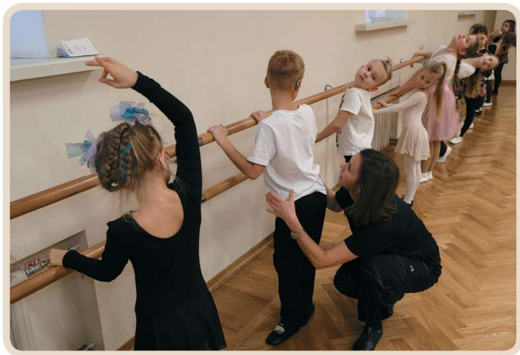
Урок классической хореографии