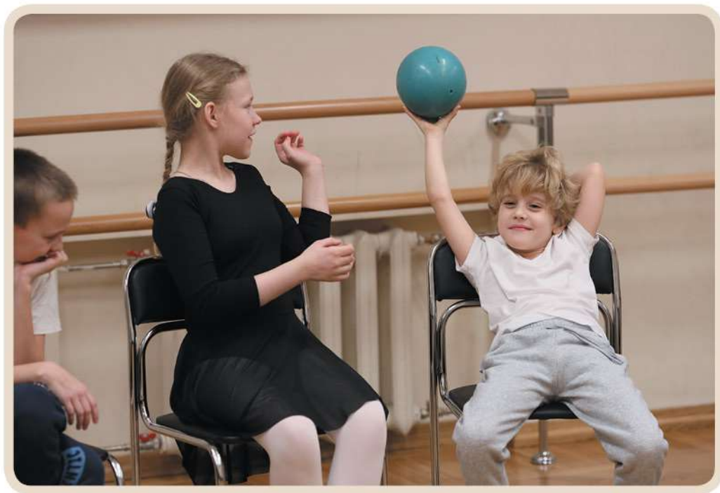
Упражнение «Передай волшебный мяч»