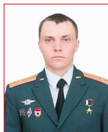
ВСУ. В ходе выполнения дальнейшей задачи командир танковой роты

Благодаря профессионализму экипажа, а также высоким навыкам ведения боя командира танковой роты, удалось переломить ход боя и нанести существенный удар подразделениям