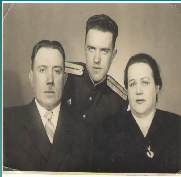
Фото: Москва, май 1995г