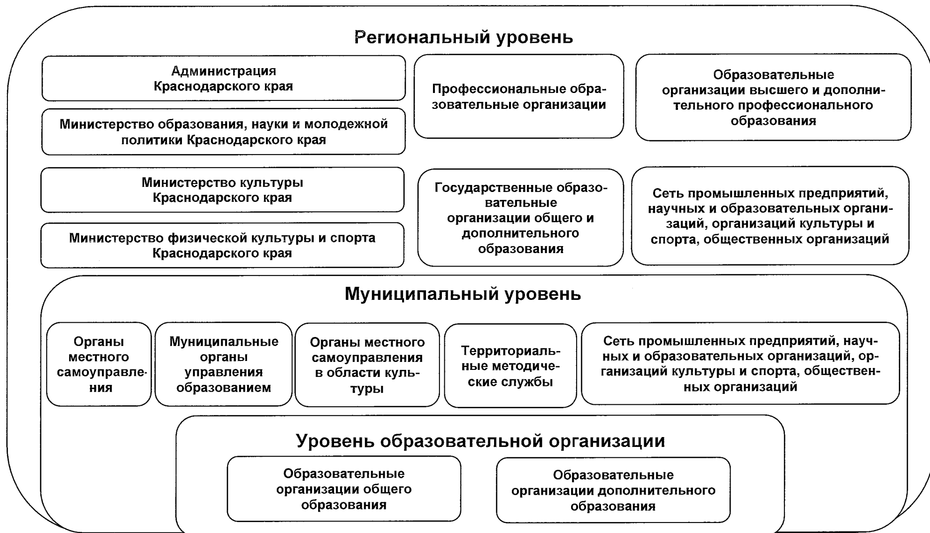
Рисунок. Уровни реализации Региональной концепции выявления, поддержки и развития способностей и талантов у детей и молодежи в Краснодарском крае на 2021 – 2024 годы