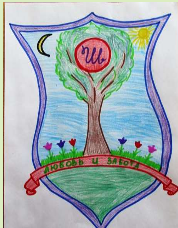
Герб семьи Шадриных