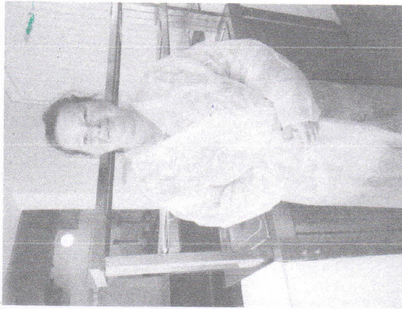
26.09.2023г. Родительский контроль мониторинга горячего питания