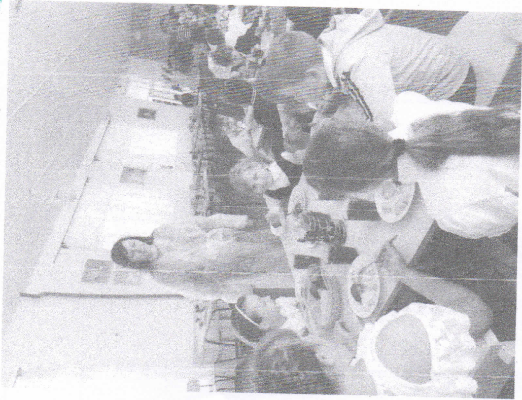
27.09.2023г. Родительский контроль мониторинга горячего питания