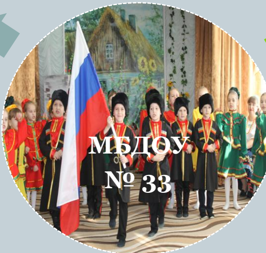
МБДОУ № 33