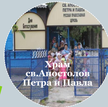
Храм св.Апостолов Петра и Павла