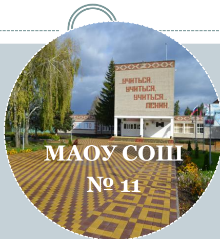
МАОУ СОШ № 11