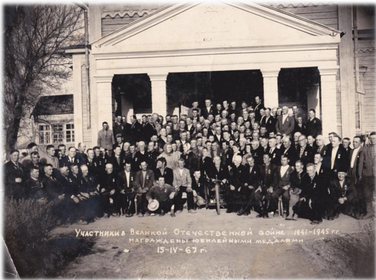
Участники в Великой Отечественной войне 1941-1945 гг. награждены юбилейными медалями 15-IV-67 г.