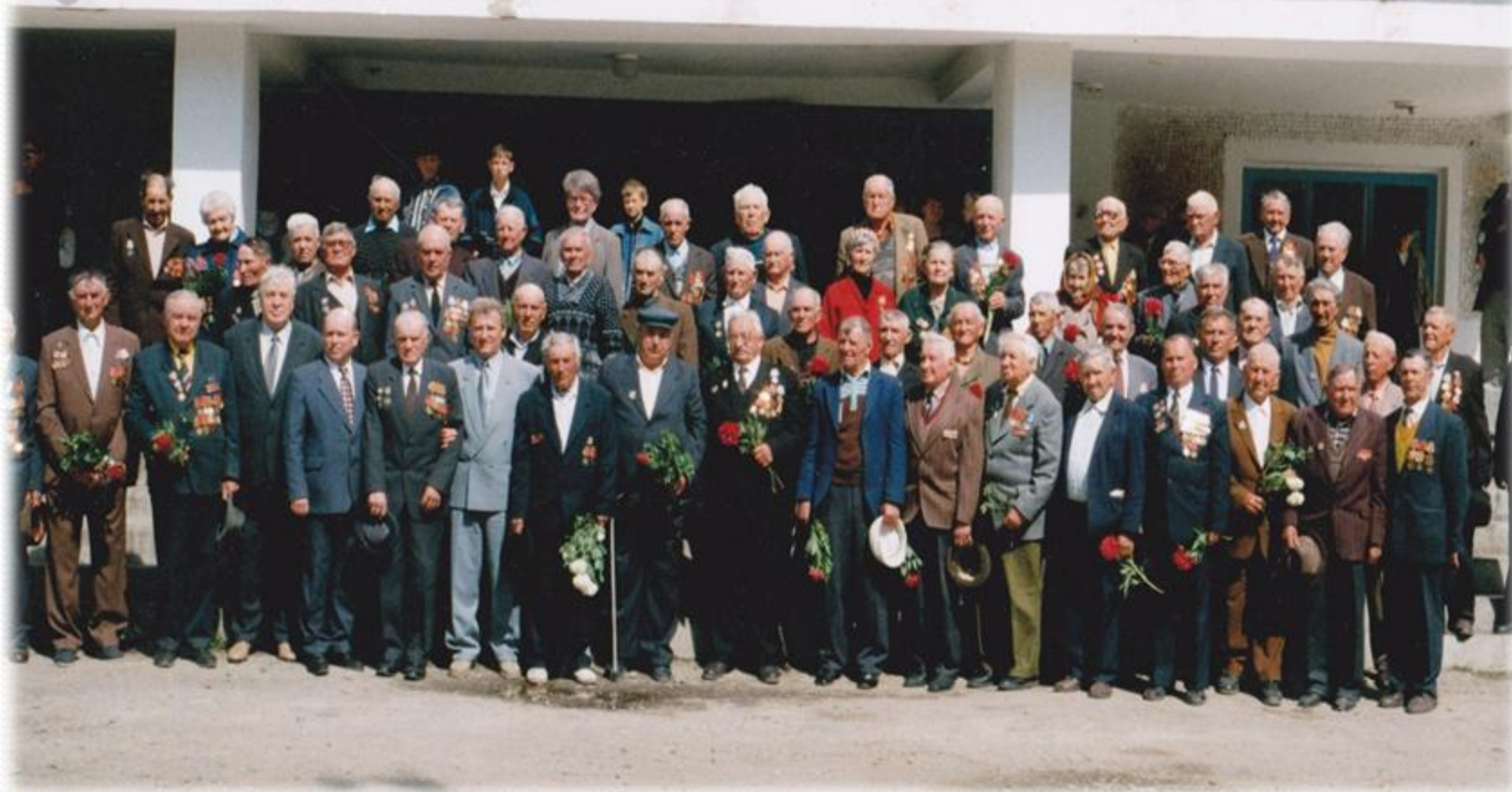
Ветераны ст. Ивановской встречают 50-летие Великой Победы.