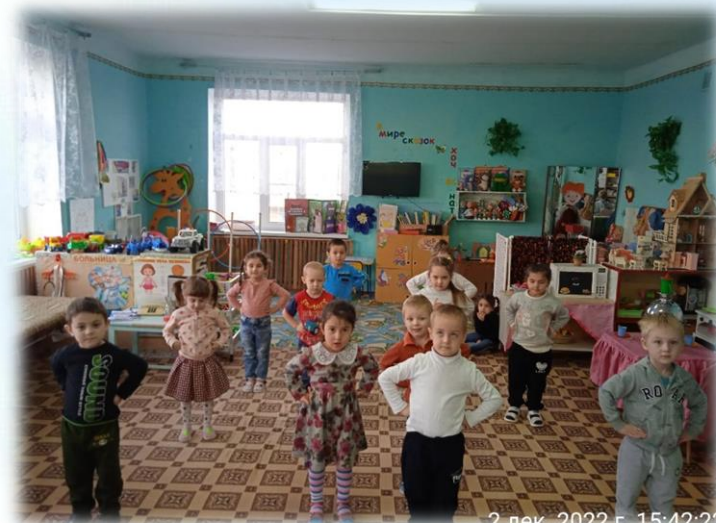
2 дек. 2022 г. 15:42:22