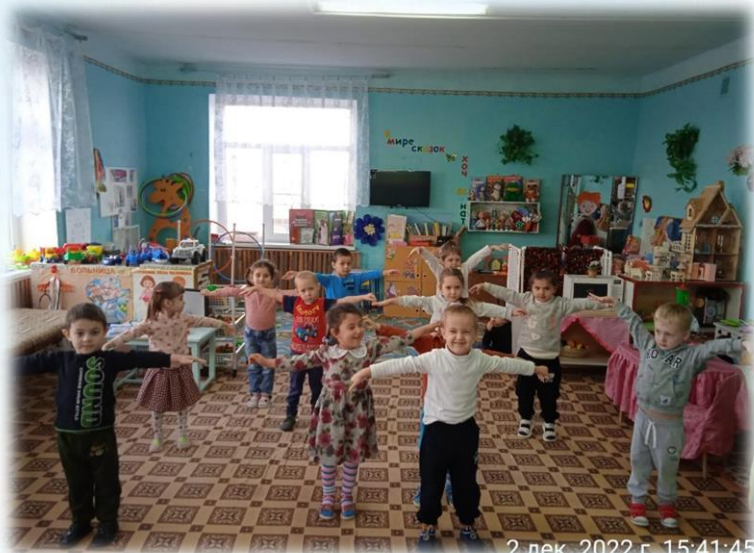
2 дек. 2022 г. 15:41:45