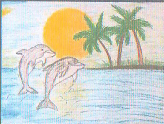
Название работы: «Море»