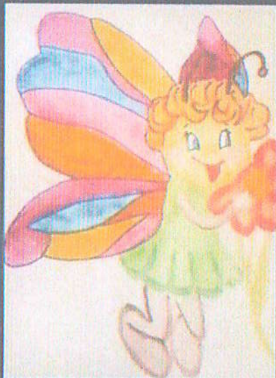
Название работы: «Бабочки»