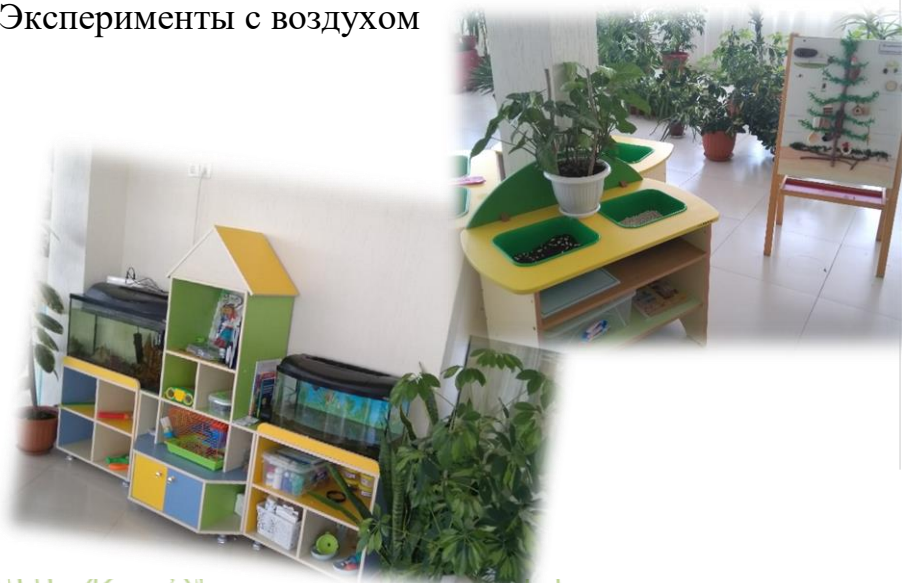
Эксперименты с воздухом