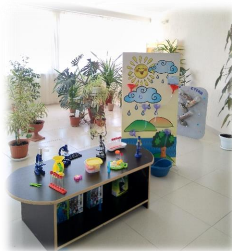
Эксперименты с песком и водой

Ведь именно в дошкольном возрасте начинается становление осознанно правильного отношения к объектам природы. Правильное понимание строится на основе знаний особенностей жизни живых существ, их взаимодействия со средой обитания, где не мало важную роль играет не только знание взрослого, но и его личный пример. Осознанное отношение к природе проявляется в разнообразной деятельности экологического характера.