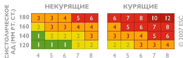
ОБЩИЙ ХОЛЕСТЕРИН ШКАЛА ОТНОСИТЕЛЬНОГО РИСКА

Для людей моложе 40 лет рекомендуется пользоваться Шкалой относительного риска . Шкала используется безотносительно пола и возраста человека и учитывает три фактора: систолическое (верхнее) артериальное давление, уровень общего холестерина и факт курения . Технология ее использования аналогична таковой для основной Шкалы SCORE.