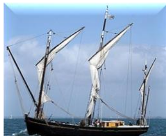
Люгер "Геленджик" - 12-ти пушечное судно

До 27 июля производился осмотр бухты и выбор места для закладки укрепления. В рапорте командующему войсками на кавказской линии генералу Эммануэлю Берхман сообщал, что после осмотра берега с лодок решено было высаживаться на Тонком Мысе. Берхман полагал, что строительство крепости в Геленджикской бухте наиболее целесообразно: с точки зрения стратегической Геленджик имел преимущество в том, что самый удобный и кратчайший путь для сообщения с Черноморией лежал к Ольгинскому укреплению через Адербиевское ущелье. Место для