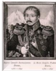
Адмирал Лазарь Михайлович Серебряков