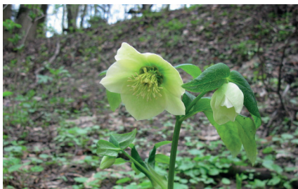
Зимовник (морозник) кавказский