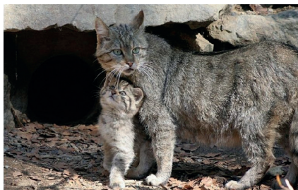
Кавказский лесной кот

Уничтожение, добывание, сбор, содержание, приобретение, владение, пользование, продажа либо пересылка редких и находящихся под угрозой исчезновения видов животных и (или) растений, занесенных в Красную книгу Краснодарского края, а также приобретение, владение, пользование, продажа либо пересылка их частей и дериватов без надлежащего на то разрешения или с нарушением условий, предусмотренных разрешением, — влечет наложение административного штрафа на граждан в размере от тысячи пятисот до двух тысяч рублей .