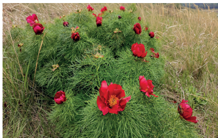
Пион тонколистный (Лазорик)