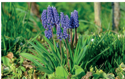
Мусари голубой (Толкачик, Мышиный гиацинт)