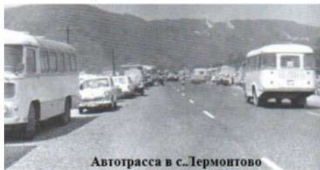
Автогасса в с. Лермонтово