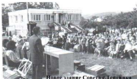
Новое здание Совета с. Тегрипка

- менее чем за год было построено здание сельисполкома; — заасфальтированы дороги, тротуары; - реконструирован рынок, построены торговые павильоны; - обустроены площадки для выездной торговли, развешиванию пунктов медпомощи;