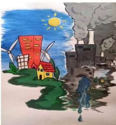
Рисунок Кочкаряна Ваге

человек и по итогам этого конкурса 5 человек стали победителями и призерами.