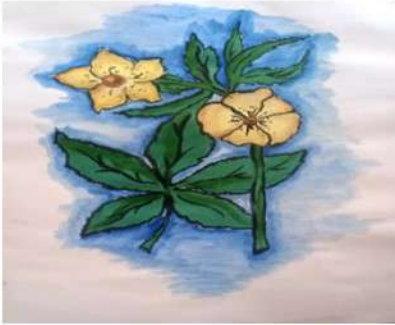
Рисунок Ханджян Назара

На зимних каникулах мы активно готовились к участию в муниципальном этапе Всероссийского конкурса экологических рисунков.