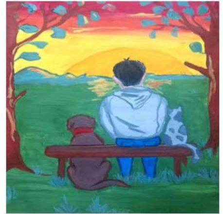
Рисунок Кислицыной Алисы ментах, любят заниматься разными видами рукоделия и талантливо рисуют.

Наши родители обладают всевозможными талантами: замечательно поют, играют на народных инстру-