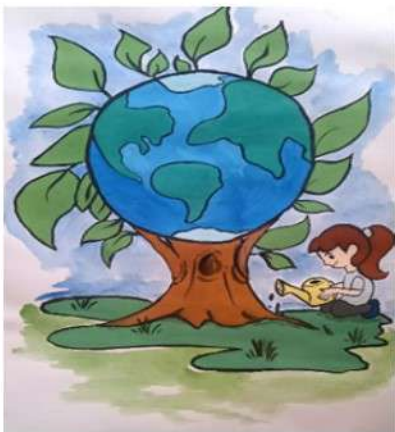
Рисунок Аведян Марии

Конкурс проводил эколого-биологический центр города Туапсе. В этом конкурсе приняли участие около 500