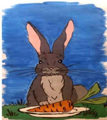
Рисунок Курдогрян Арарата

Клубные формирования или проще кружки, которые ведутся в Тенгинском Доме культуры полностью подходят под модель, которую я нарисовала себе. Это всегда содружество, сотворчество руководителей кружков, родителей и детей.