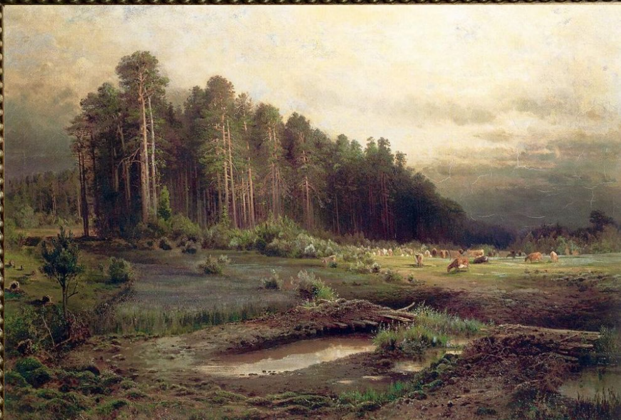
«Лосиный остров в Сокольниках»