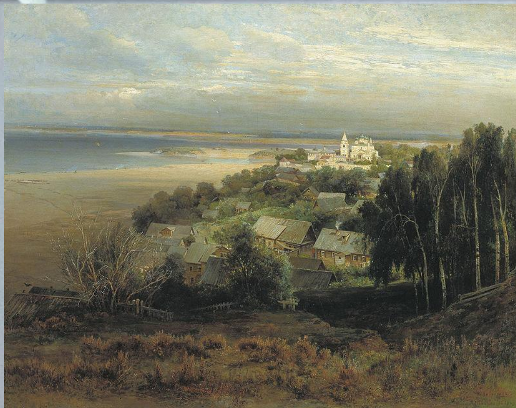
«Печёрский монастырь под Нижним Новгородом»