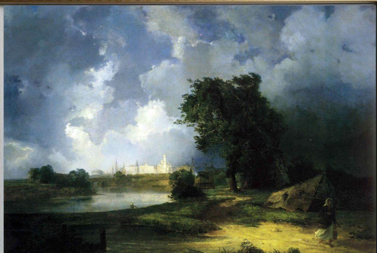
«Вид на Кремль от Крымского моста в ненастную погоду»