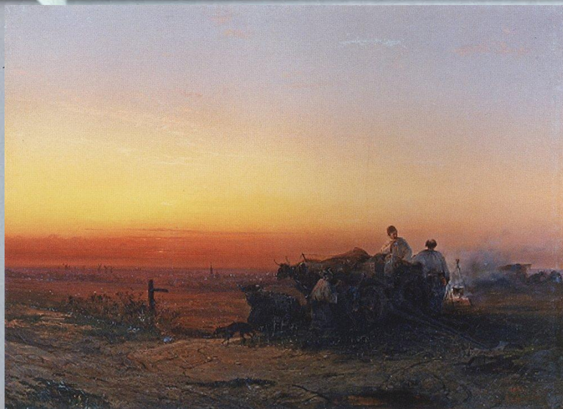
«Степь с чумаками вечером»