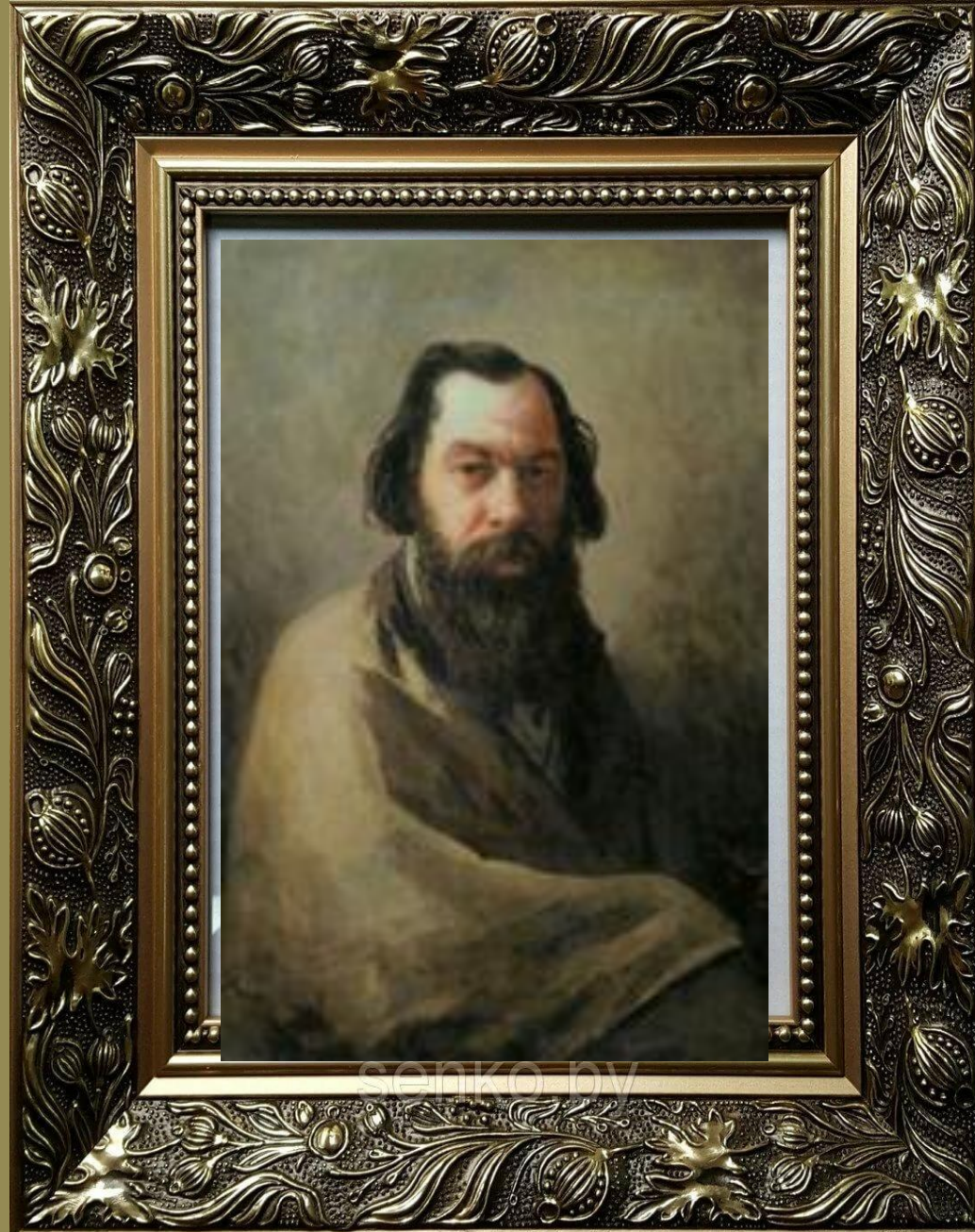
Алексей Кондратьевич Саврасов 1830 - 1897