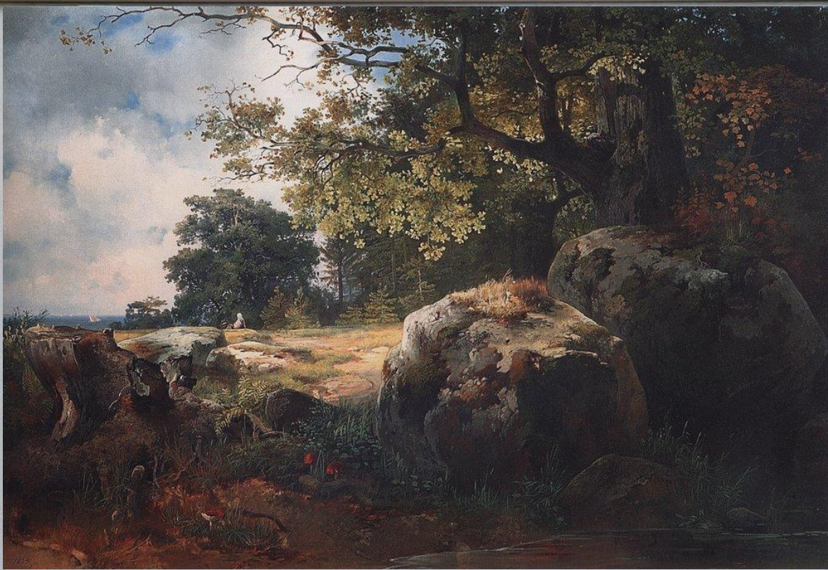
«Вид в окрестностях Оранienбума»