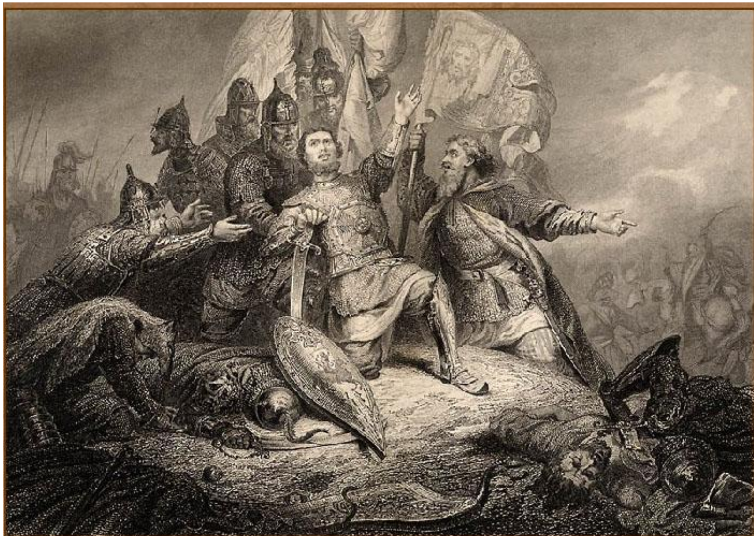
Пожарский в битве под Москвой