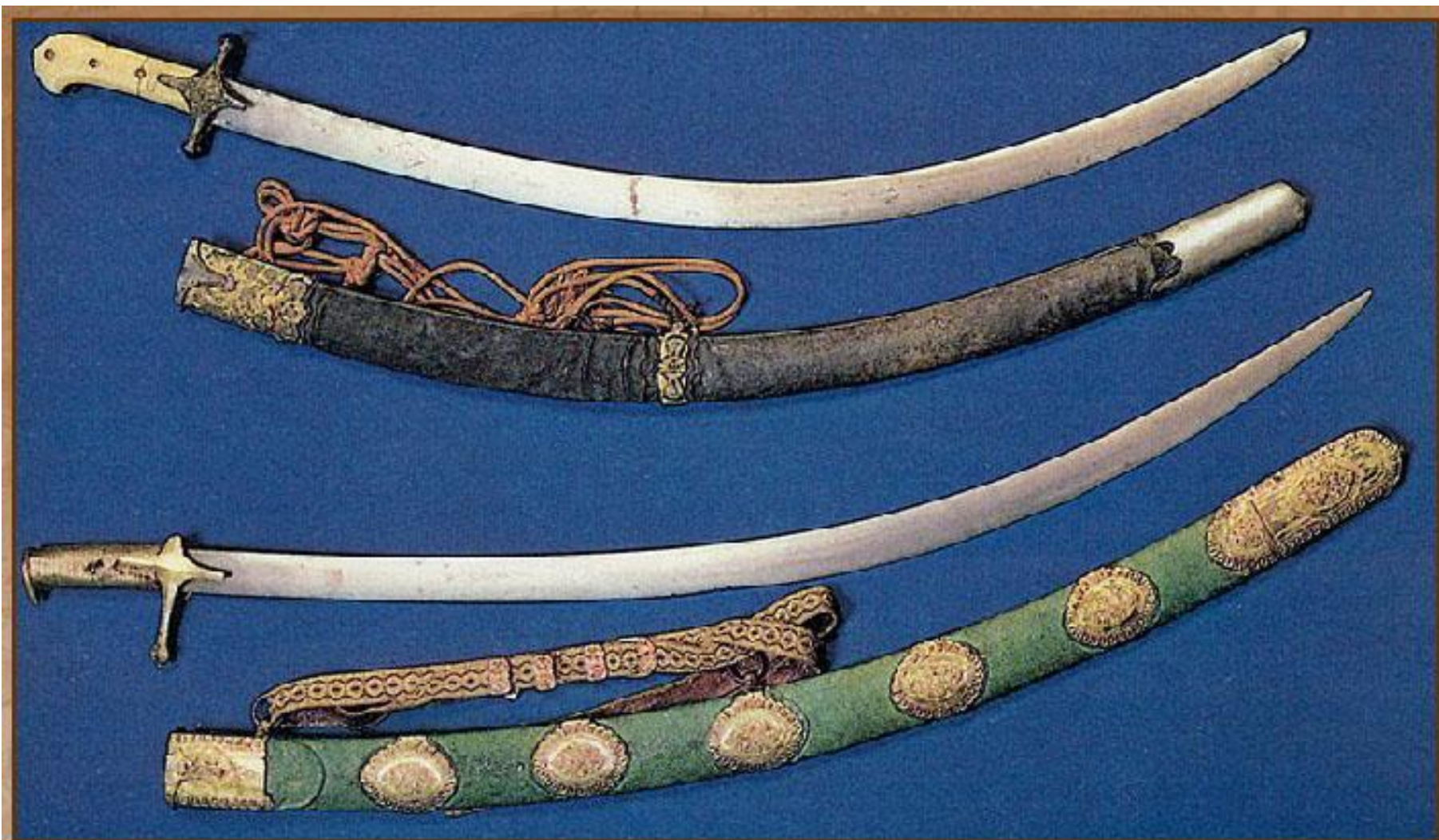
Сабли К. Минина и Д. Пожарского