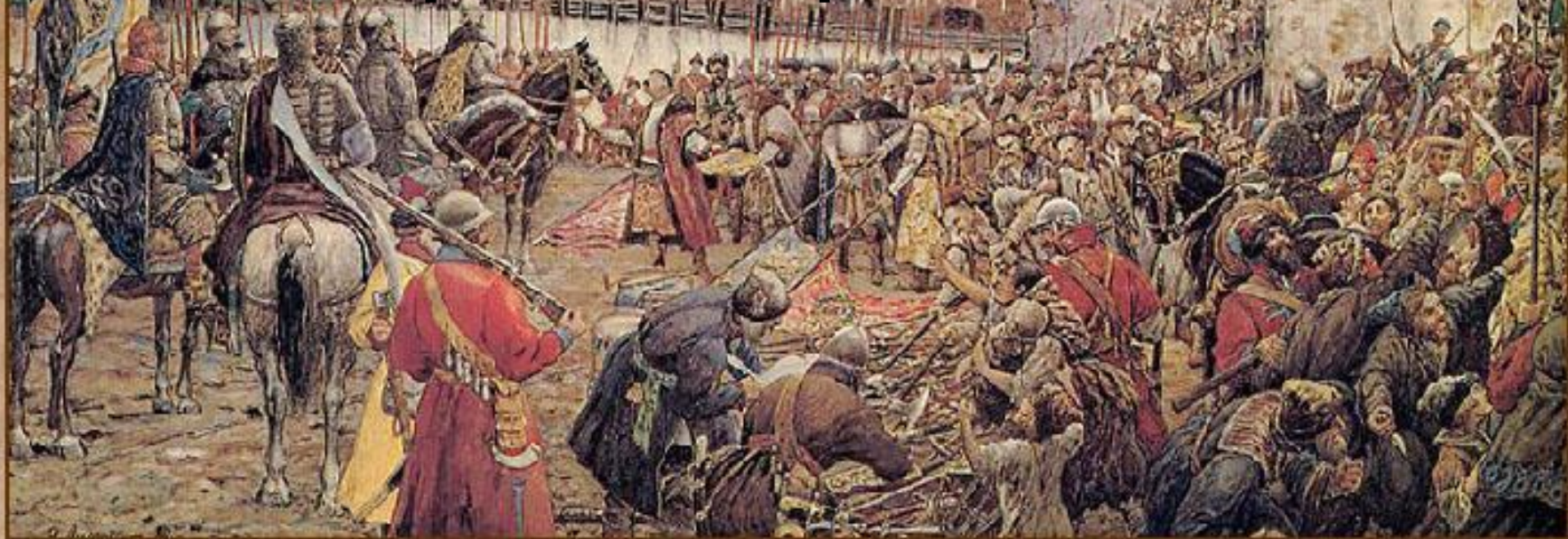
Изгнание польских интервентов из Московского Кремля в 1612 г.

22 октября на день обретения иконы Казанской Богоматери, сопровождая ополчение, был взят Китай – город. Через четыре дня сдался польский гарнизон в Кремле.