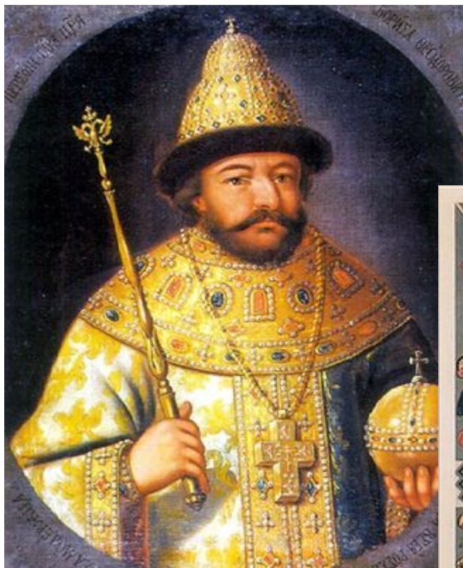
Борис Годун ов