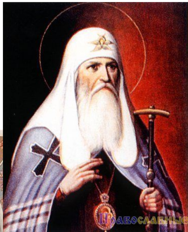
Патриар х Гермоге н