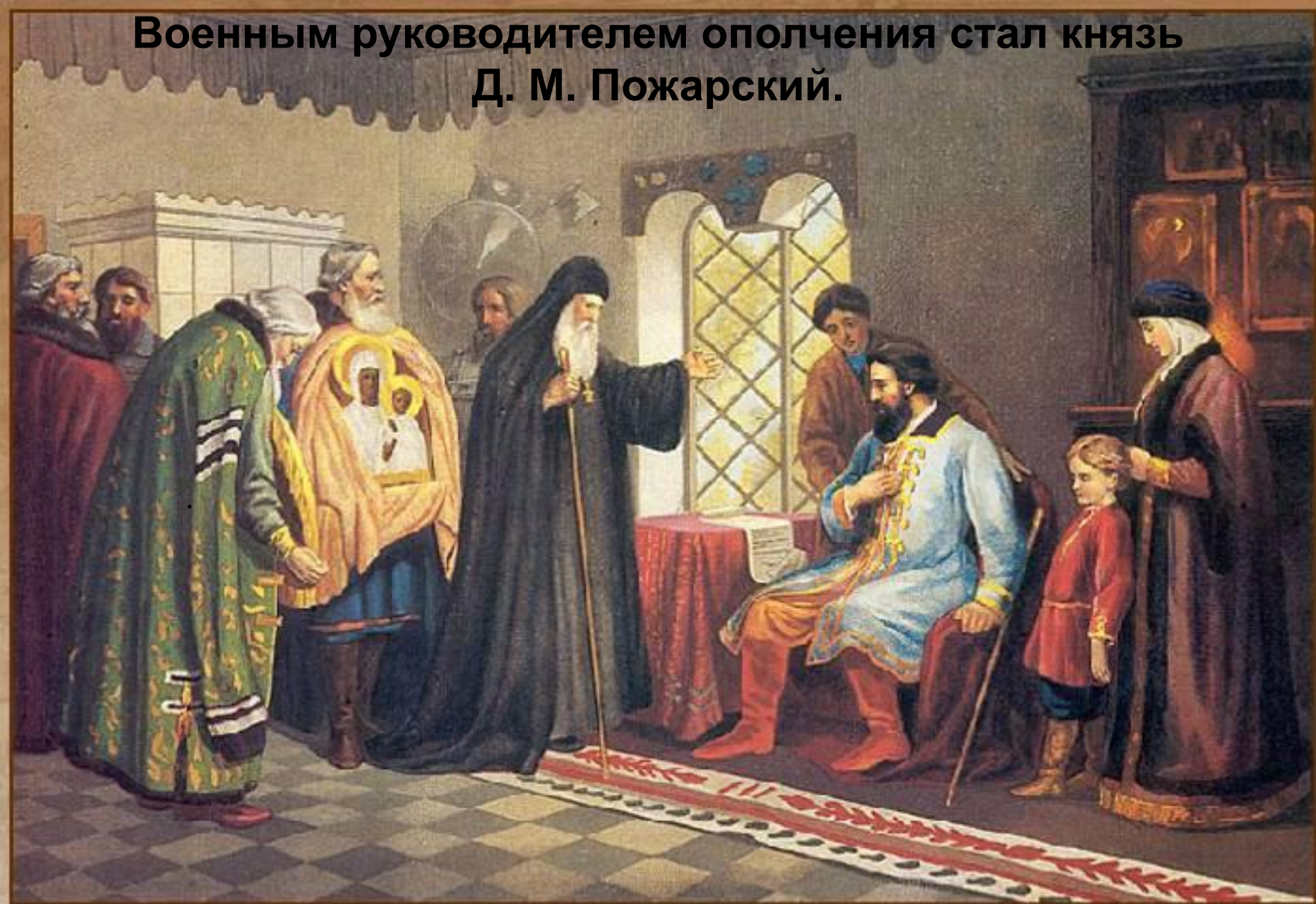
Нижегородские послы у князя Дмитрия Пожарского. 1611 г.

Военным руководителем ополчения стал князь Д. М. Пожарский.