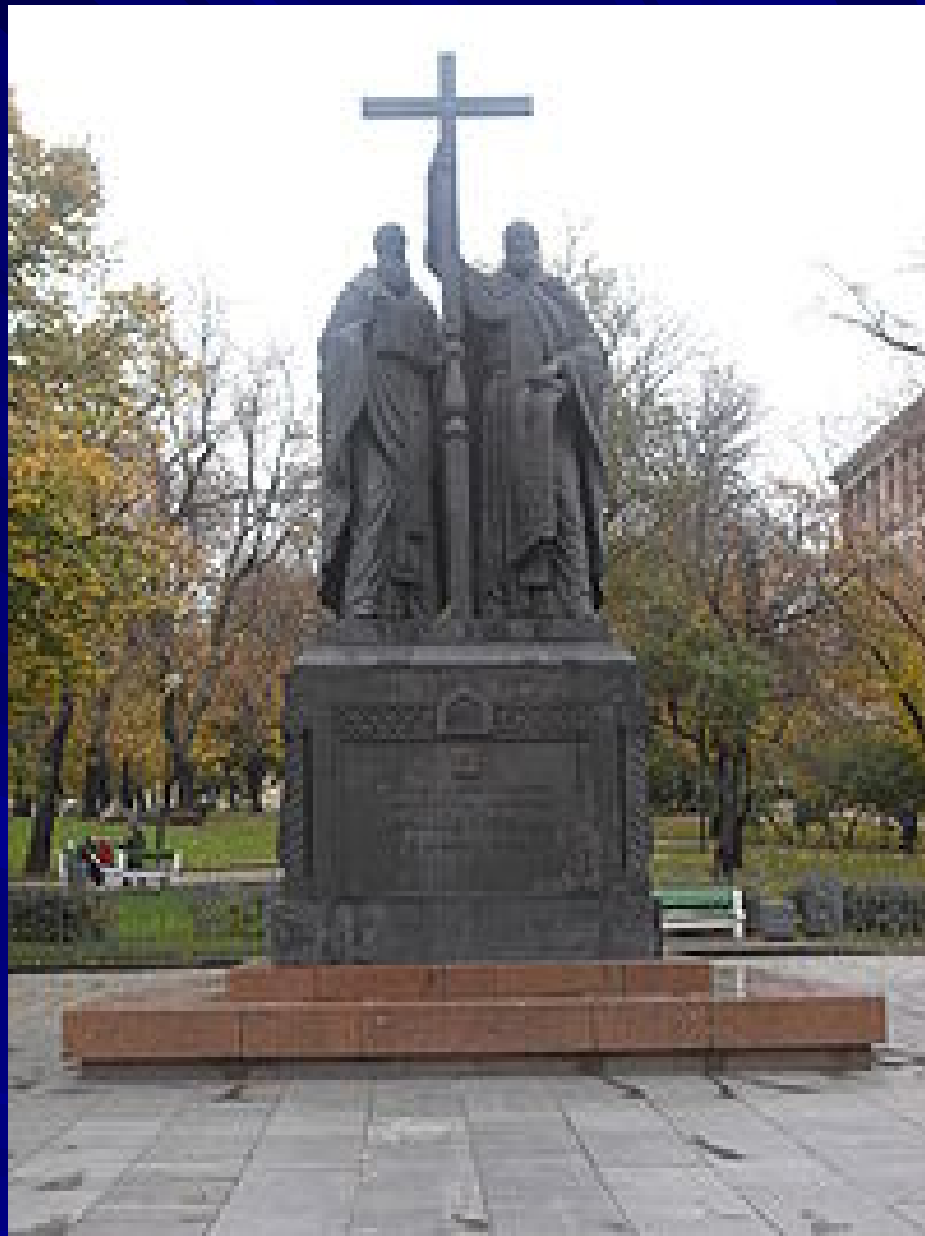
Памятник Кириллу и Мефодию в Москве