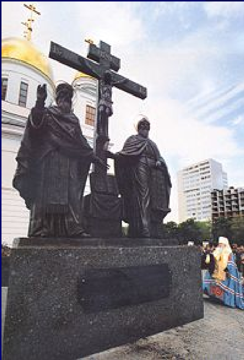
Памятник Кириллу и Мефодию в Самаре