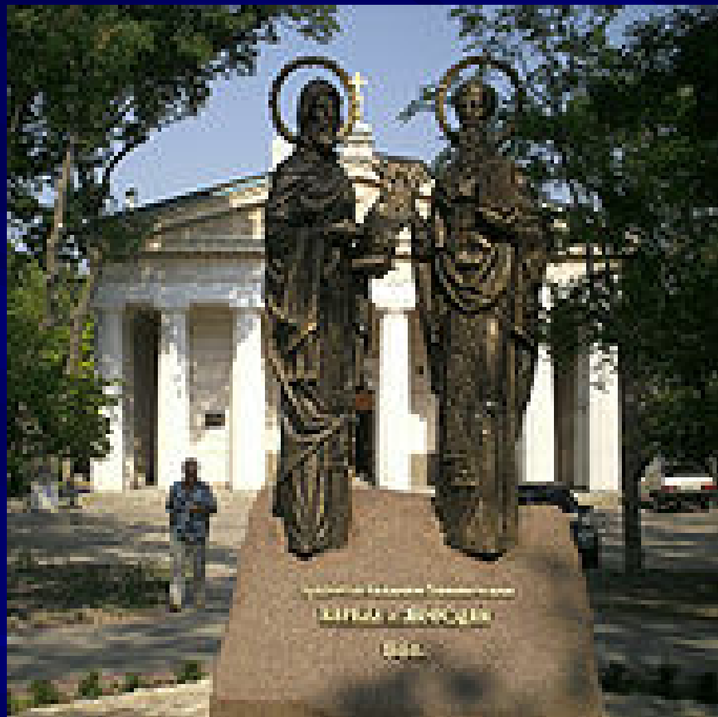
Памятник Кириллу и Мефодию в Севастополе

До пострижения в монахи братьев звали Константин и Михаил. Они были очень образованными людьми. Святые Кирилл и Мефодий своей проповедью много способствовали утверждению христианства в Болгарии, где находились примерно с 850 года. Из Болгарии христианская вера распространилась в соседнюю с ней Сербию.