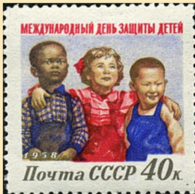
Советская почтовая марка - этикетка, посвящённая Международному дню защиты детей