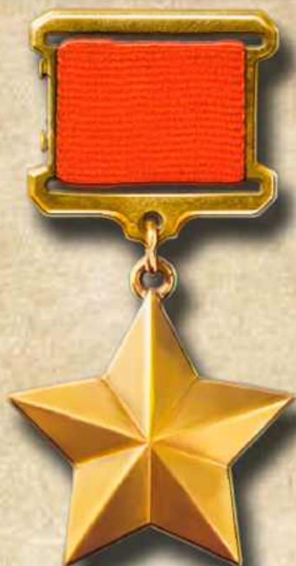
Медаль «Золотая звезда»