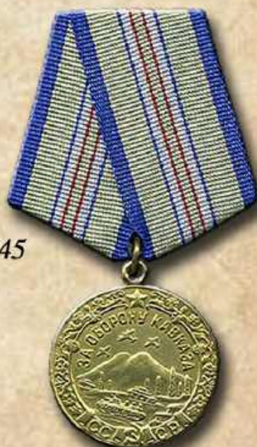
Медаль «За оборону Кавказа»