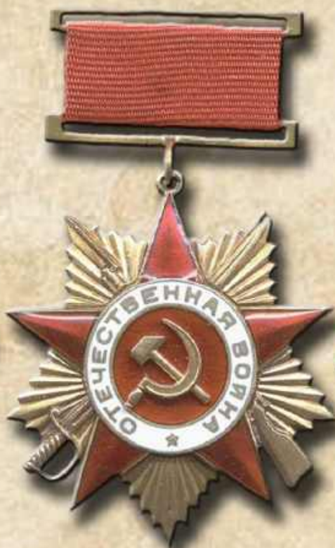
Орден Отечественной войны 1-й степени