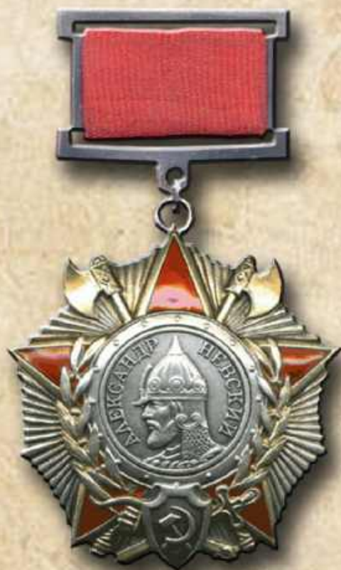
Орден Александра Невского