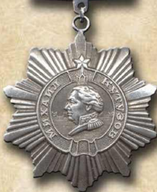
Орден Кутузова III степени