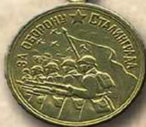
Медаль «За оборону Сталинграда»