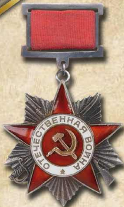
Орден Отечественной войны 2 степени