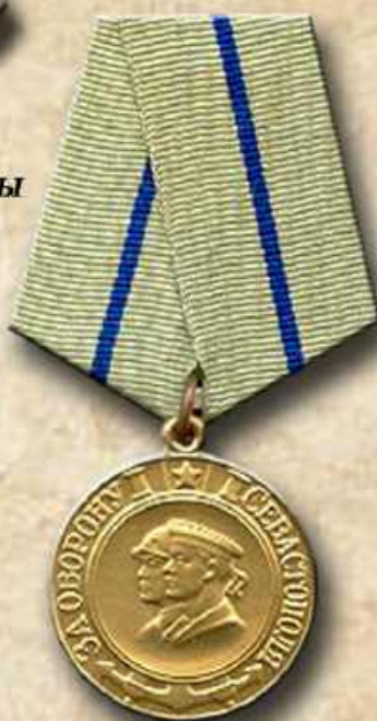
Медаль «За оборону Севастополя»