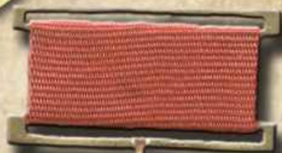
Орден Отечественной войны 1-й степени