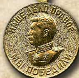
Медаль за победу над Германией 1941-1945