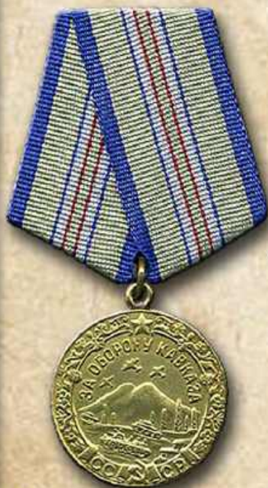
Медаль «За оборону Кавказа»