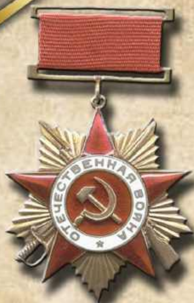
Орден Отечественной войны 1-й степени