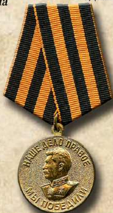
Медаль «За победу над Германией 1941-1945 гг.»