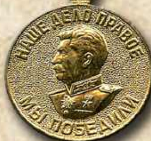
Медаль за победу над Германией 1941-1945