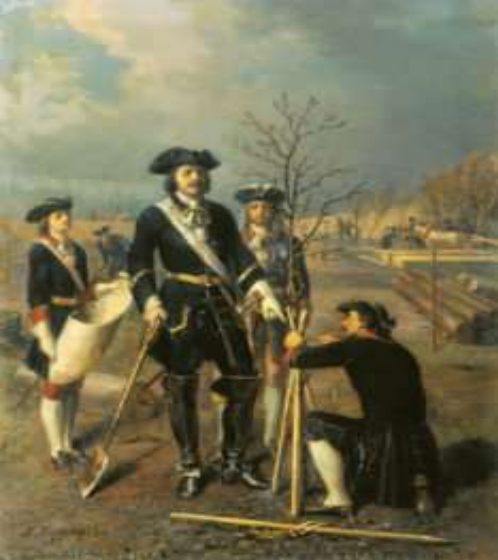
«Петр I за работой»