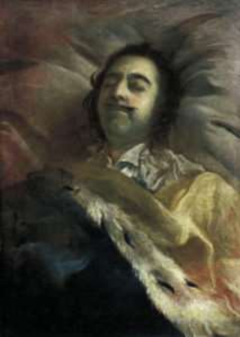
«Пётр I на смертном одре», И. Н. Никитин 1725

Никитину приходилось писать картину начисто, без поправок, мастерски используя прием письма светлых тонов по-темному, что требует больших умений.