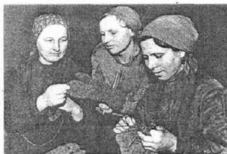
Во время войны женщины Анапы оказали теплые вещи и открыли их на фронт.

на участке Анапа – Миссако, уничтожение гарнизона противника в селе Варваровка.