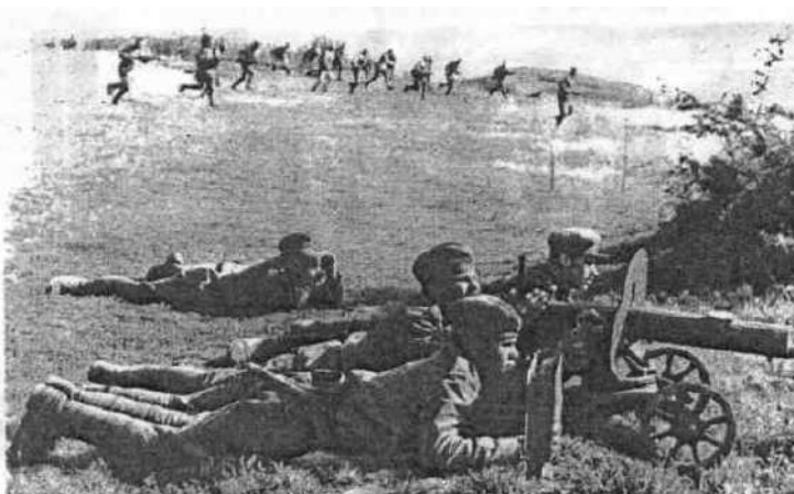
Своим примером увлекал бойцов пулемётного взвода на уничтожение врага и его техники