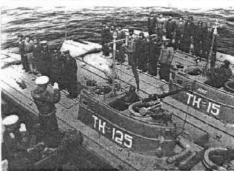
Торпедные катера получают приказ на выход

дромы и порты, гитлеровцы предприняли меры предосторожности. Были усилены дозоры, выделены специальные группы сторожевых катеров для охраны рейда. Но советские катерники продолжали набегать, по-прежнему сваливаясь на врага как снег на голову и наносили удар за ударом.