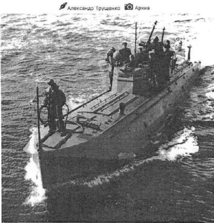
Катер Г-5 Черноморского флота идёт на швартовку