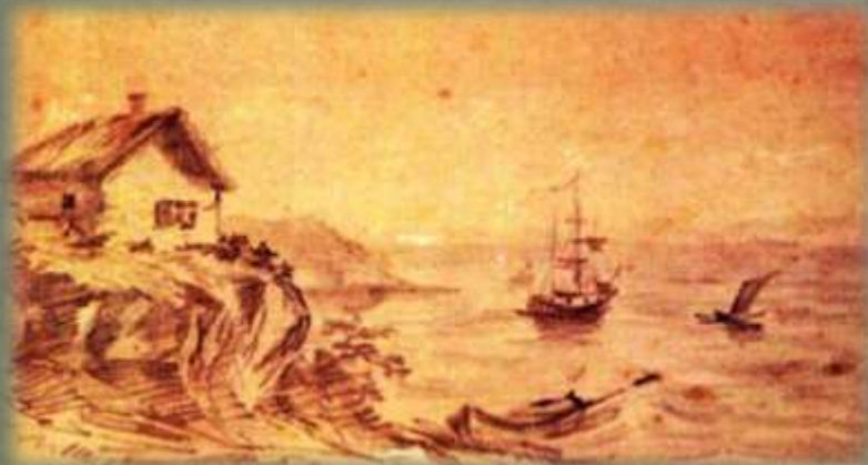
Тамань. Рисунок М. Ю. Лермонтова (1837 г.)

10. В каких произведениях М.Ю. Лермонтов рассказывает о Кубани?