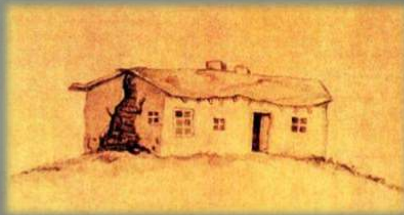
Хата, в которой останавливался М. Ю. Лермонтов в 1837 г. Рисунок Е. Д. Фелицына.