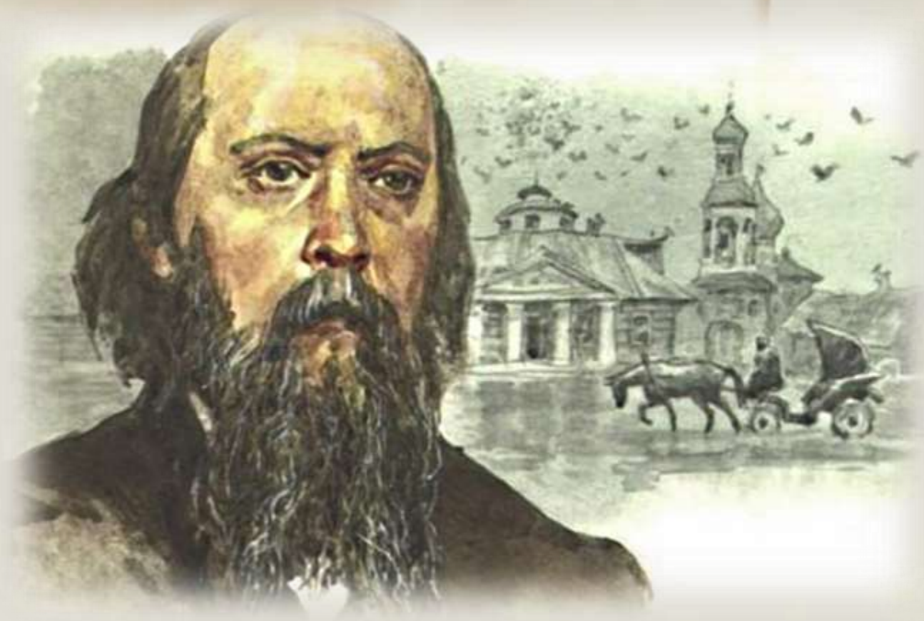
Михаил Ефграфович Салтыков-Щедрин