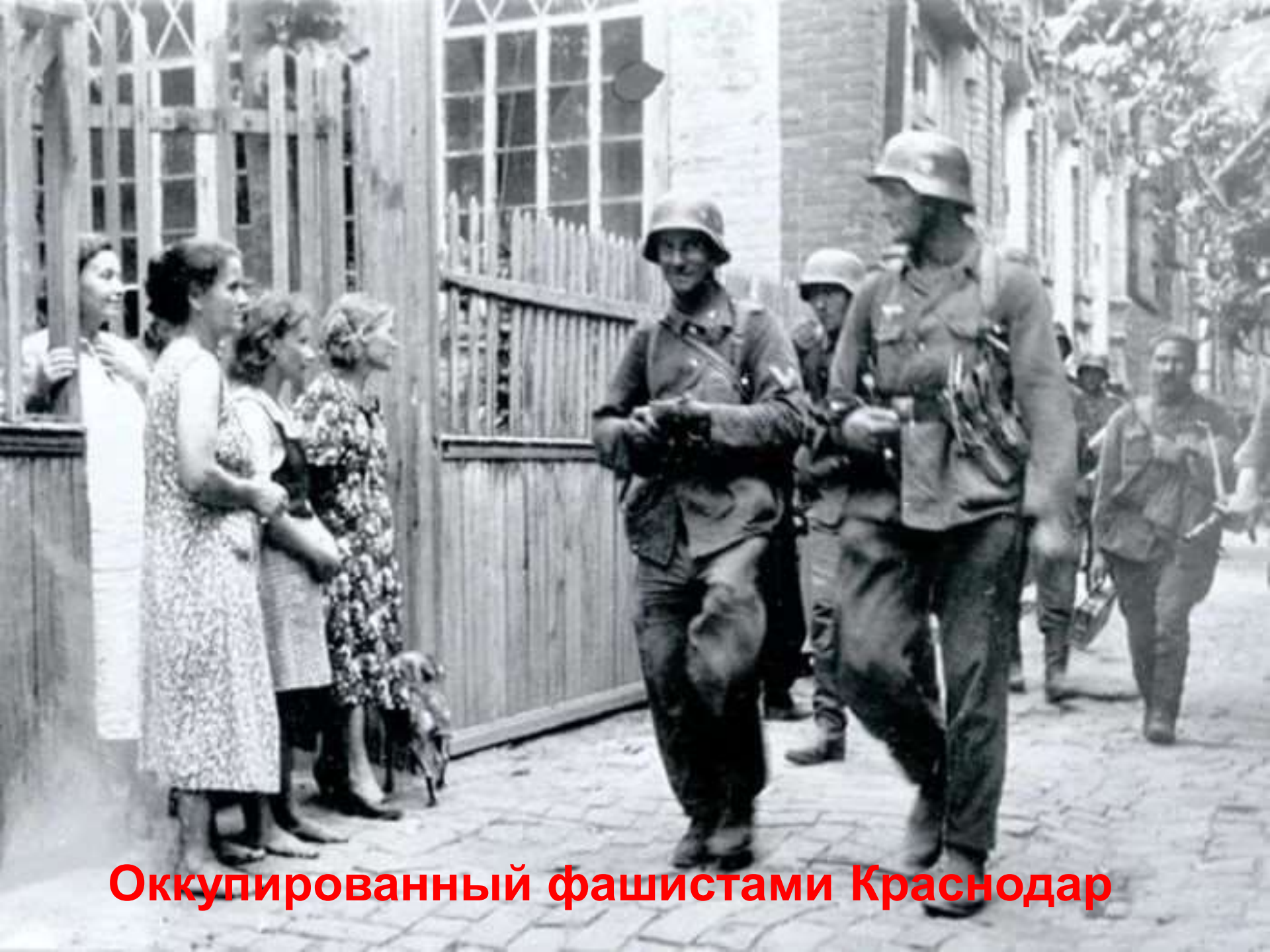
Оккупированный фашистами Краснодар